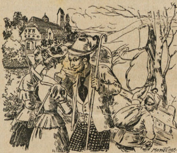
Kje je radovedna starka?

Dva postopača vidé kmeta, ki seje na njivi rečeta: „Oče, vi sejete pa mi dva bova vživala plod vaših žuljev!“ „Mogoče — mogoče“, odgovori kmet „ker ravno sejem konoplje — za bič“.