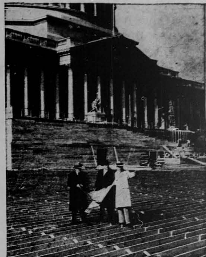
Kongresni odbor pregleduje tribuno, ki se dviguje pred kongresno zbornico za tretjo inauguracijo predsednika F. D. Roosevelta.