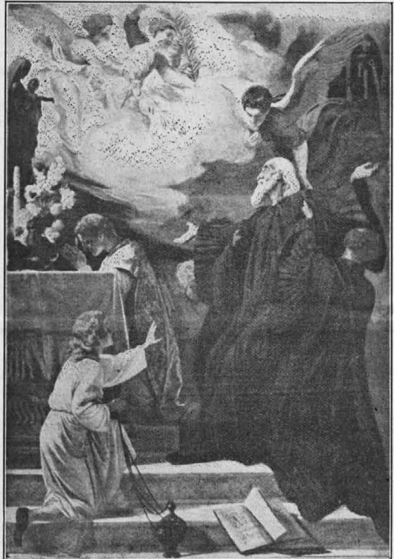
SMRT SV. BENEDIKTA.