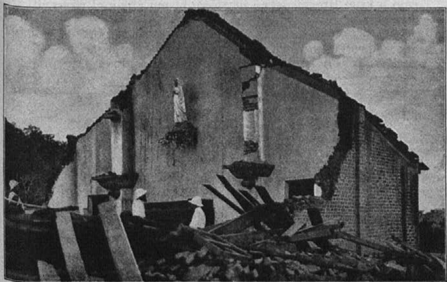
Porušena cerkvice v Baugri. Kip Brezmadežne še stoji.

Najsvetejše smo zaenkrat spravili v šoli, ki je bila mala koča iz ilovke, pokrita s slamo. Naši kristjani se ne dajo potolažiti in neprestano molijo k Bogu za pomoč. Vsa obširna okolica je zdaj brez cerkve. Nad 500 kristjanov, ki bivajo v bližini, ne vedo, kam naj bi se zbrali k molitvi.