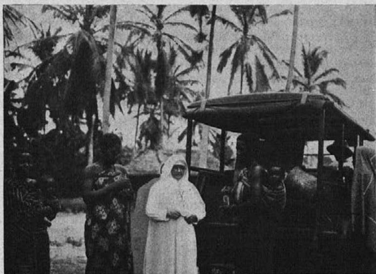
Potujoča lekarna. Misijonska sestra Dragocene krvi se pelje s tem vozom vsak teden v oddaljene zamorske vasi in deli bolnim zdravila.

časa, da bi redno poučeval krščanski nauk, ker je toliko šol in še tako oddaljenih. Tu so potem res sestre domačinke kot poklicane za katehistinje, ker jezik znajo in otroke poznajo. Na našem misijonu imamo sedaj izmed domačink tri učiteljice, ki uče na vladnih šolah. Poučujemo celo vrsto kandidatinj, ki se pripravljajo na pouk. Druge sestre delujejo kot katehistinje odraslih, za kar se že v noviciatu skrbno pripravljajo, in potem iz nadnaravnih nagibov res pridno delujejo. Druge hodijo peš v bližnjo okolico, zopet