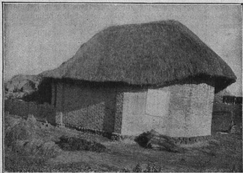
Porušena misijonska cerkvica v Afriki (Pref. Srednji Nil).

proti navalu poganstva v teh krajih. Zato sem prepričan, da Vas bo veselilo, ko Vam povem, da smo dokončali veliko in važno delo v čast božjo. V nedeljo 14. junija se je opravila prva slovesna služba božja v novi cerkvi Srca Jezusovega. To je bil res nenavaden prizor, kakršnega ni videti v teh oddaljenih in slabo preskrbljenih misijonskih pokrajinah. Kaj takega sem dozdaj le dvakrat še doživel. Ševeda so se naši kristjani mnogoštevilno zbrali, da so bili pričujoči pri tej slavnosti. Spravno sv. obhajilo v čast presv. Srcu Jezusovemu je bilo znak globoke in otroške ljubezni do našega Gospoda in mojstra Jezusa Kristusa.