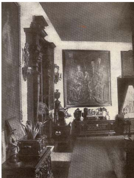
Hodnik v drugem nadstropju z vhodom v veliki salon. Na prednji steni je slika družine Wolfa Adama barona Erberga, na levi steni pa slika Janeza Jurija Lemberga.

Dražba premičnin je potekala od 12. maja 1930 dalje. Najprej so prodajali rastline, sledile so slike in skulpture, majolika, porcelan, steklo, obleka, perilo, tkanine, kuhinjsko posodje in razno orodje. Od srede junija dalje je potekala prodaja pohištva.