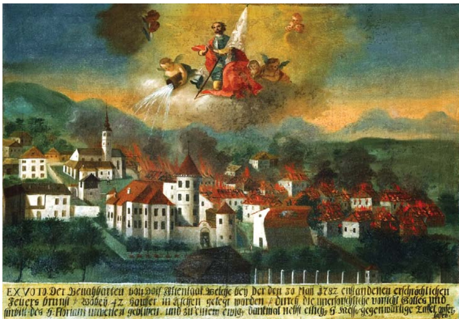
Starološki grad na votivni sliki iz cerkve sv. Florijana v Sopotnici, 1782.