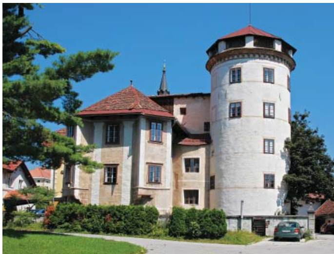
Starološki grad danes.