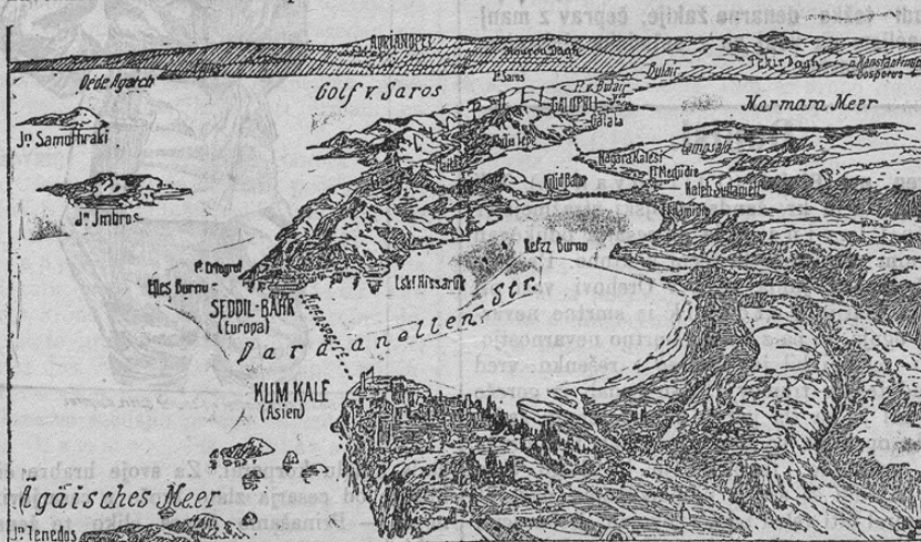
Die Dardanellen-Strasse aus der Vogelschau.

čin svojo dolžnost. Vsi napori angleško-francoske mornarice in armade, da bi si osvojili Konstantinopol, so se doslej pod velikanskimi izgubami za sovražnika izjalovili. Morske ceste Dardanel