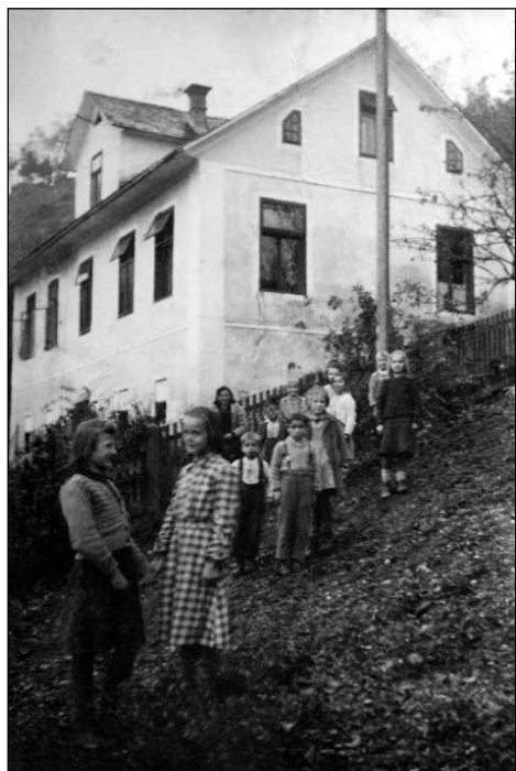
Šola v Podlonku po drugi svetovni vojni.