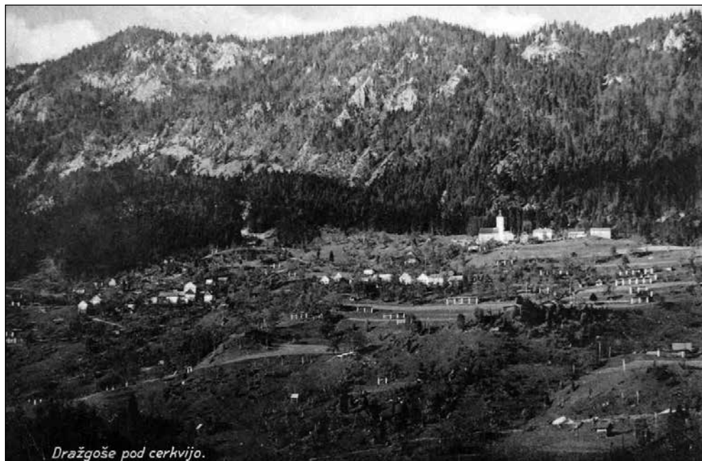
Razglednica Dražgoše pod cerkvijo leta 1943.

cerkve na Kranjskem so v Mojstrani, na Rodinah, v Tupaličah, Suhadolah, Bukovščici in drugod.