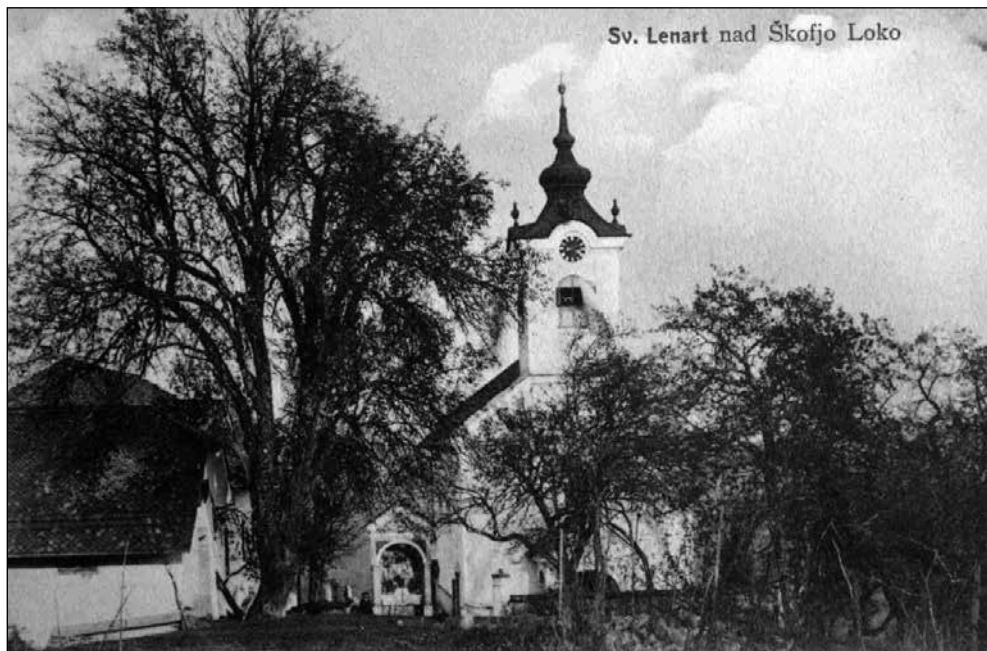
Sveti Lenart nad Škofjo Loko pred drugo svetovno vojno.

koncu stoletja, ko je v času vlade Jožefa II. prišlo do temeljite preureditve župnij. 28