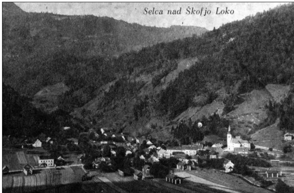
Razglednica Selca leta 1930.

Papež Klement IV. je leta 1352 župnijo in vse njene vikariate inkorporiral v škofijsko menzo z vsem premoženjem in dohodki. V cerkvenem pogledu pa so z ustanovitvijo dekanij leta 1788 Selca skupaj z župnijama Železniki in Zali Log, vikariatom Sorica in lokalijami Bukovščica, Dražgoše in Sveti Lenart pripadla dekaniji Železniki. V letih 1793 in 1794 je