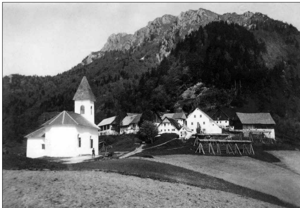
Cerkev Marije Pomočnice in Prtovč po drugi svetovni vojni.

Tudi strešno ogrodje na cerkvi je bilo iz leta 1870, a celotno streho so na novo prekrili leta 1935. 91