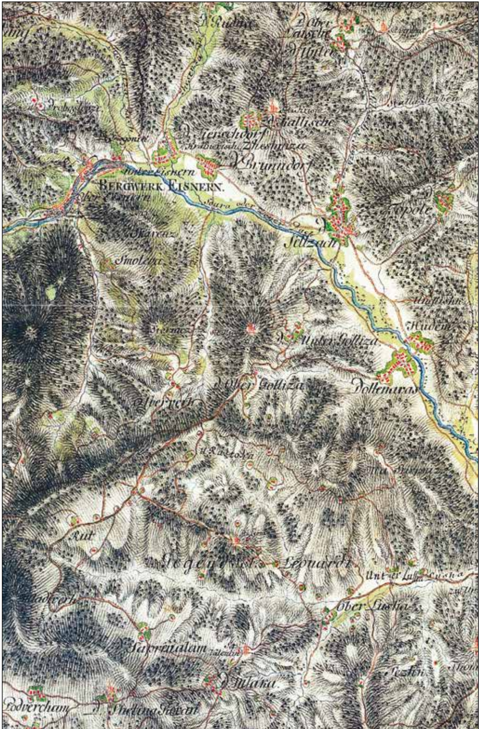
Izsek iz Slovenije na vojaškem zemljevidu (1763–1787).