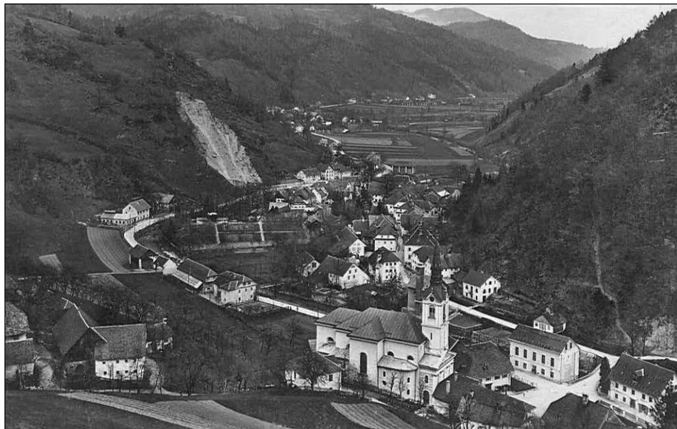
Škovine (spodnji levi del fotografije), cerkev sv. Antona, Trnje in Racovnik okrog leta 1938.

Kljub vsem dogovorom in dokumentom pa je bila stvar dejansko precej drugačna. Ko je hotel selški župnik v Železnikih maševati, je ugotovil, da je bil odtrgan njegov pečat, kelih in mašno oblačilo pa sta mu bila nedostopna.