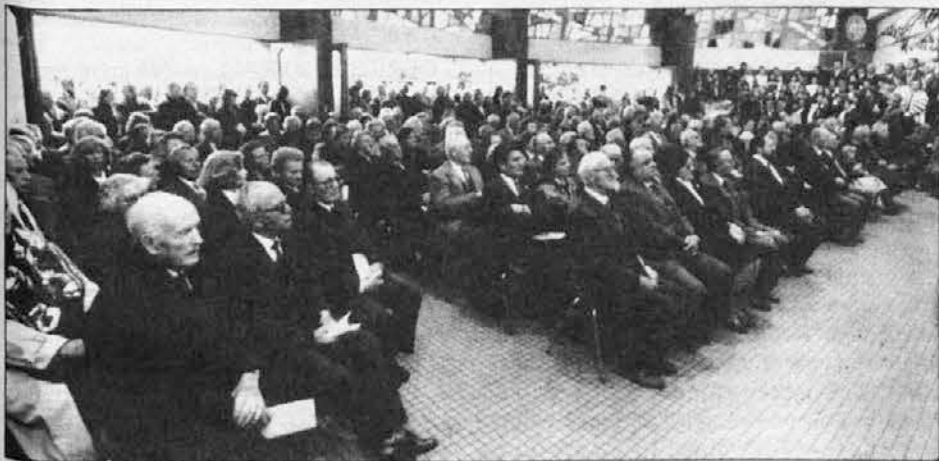
Zgoraj: Množica pri spominski maši.