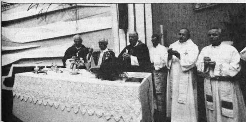
Spodaj: Slovenski dušni pastirji pri maši.