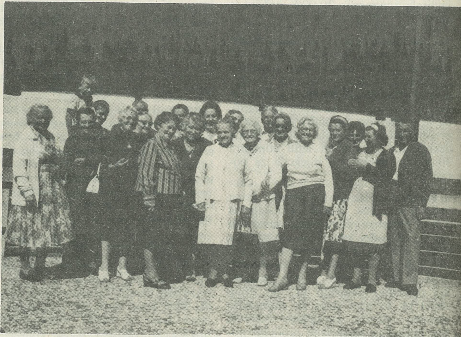
Izlet skupine upokoencev SDM na Dandenong