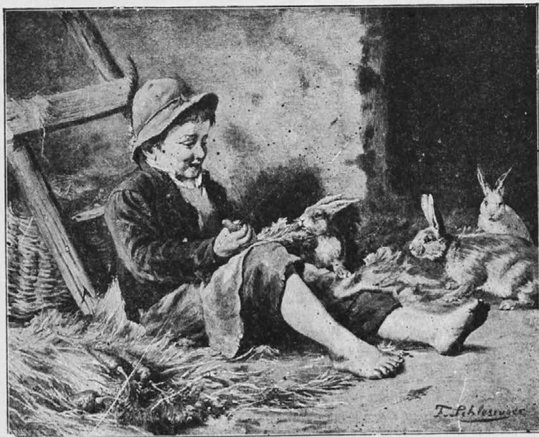
Zajček z zajčki.