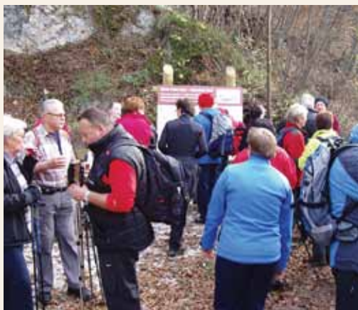
Postanek na urejenem počivališču pod Žitkovskim brdom.

ne šole Laško in 10 otrok v spremstvu staršev.