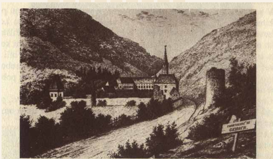
JURKLOŠTRSKA GRAŠČINA IZ KONCA 19. STOLETJA. POGLED Z VZHODA