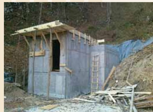
Vodohran Povčeno 40 m 3

Vodovod Vrh-Radoblje-Globoko sta oba izvajalca skupaj s podizvajalci že pričela graditi. Dela potekajo na območju Povčena, Globokega, Zg. Strenskega, Zabreža, Konca, Lažiš in Sela, ker bi želeli kar se da izkoristiti lepo vreme, pa izvajalci delajo s polno močjo.