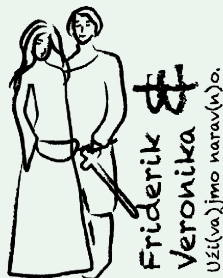
Logotip blagovne znamke Friderik & Veronika