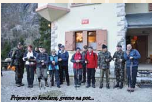
Prisravnice so končane, gremo na pot...