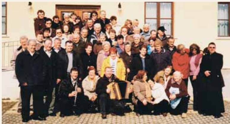
Na fotografiji: eno iz letošnjih romanj na Veličini