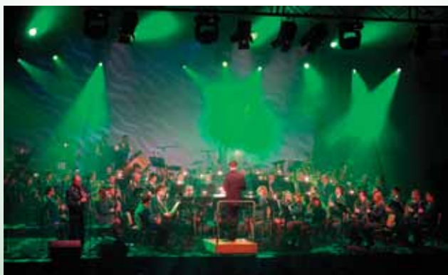
Organizatorji: Občina Laško, Laška pihalna godba, Pivovarna Laško, Stik