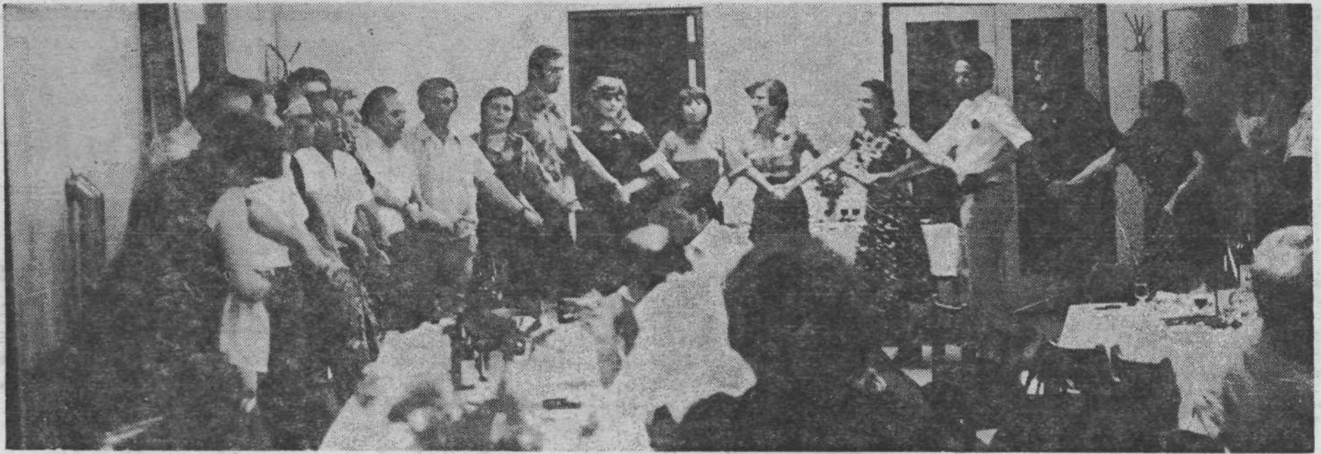
Tako, kot se je srečanje odvijalo ves dan, se je tudi zaključilo. Pesem, borbena, partizanska ali brigadirsko in kolo, ki združuje...