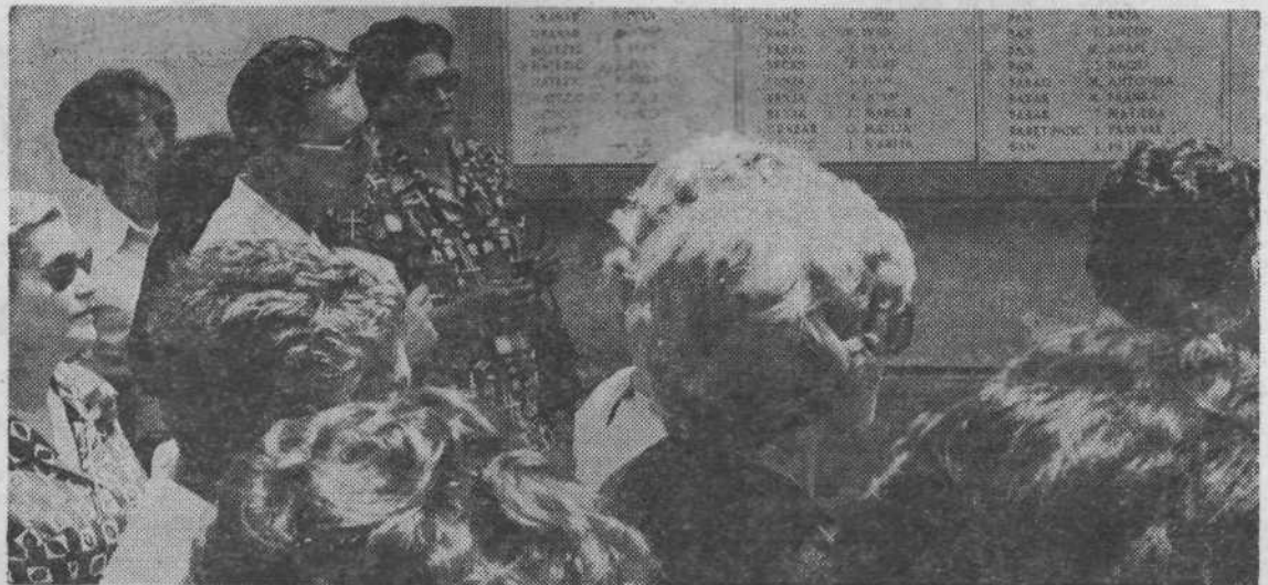
Da so bili pred več kot tridesetimi leti tudi za Rečane težki časi, opozarja spominska plošča s spiskom usmrčenih domoljubov.