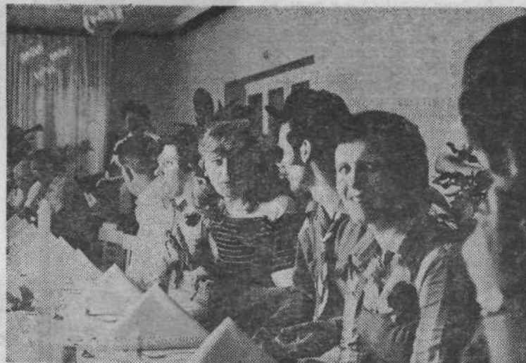
V razgovorih o krajevni samoupravi, delegatskem sistemu in političnem delu so tvorno in aktivno sodelovali tudi mladi iz obeh pobratanih mest.