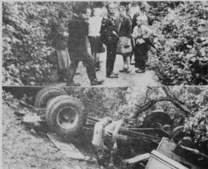
Na tem mestu je tovornjak KN 127-31 zdrsnil v globel. Spodnja slika kaže, kako je obtičal ob hruški.