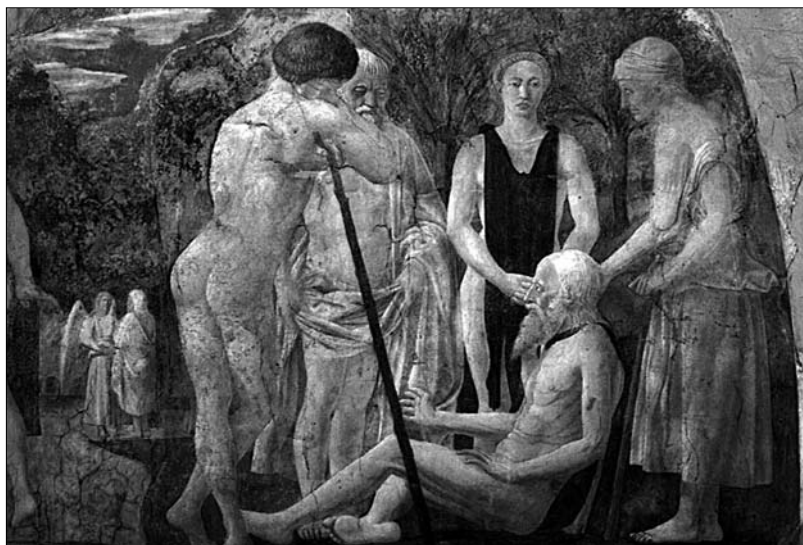
Piero della Francesca, Adamova smrt, detajl: Adam in njegovi otroci, 1452, freska, 390 x 747 cm (cela slika), San Francesco, Arezzo.

vsem odvisna od denarja, imetja, položaja v družbi in od politične moči. Kadar se človeštvo navdušuje za absolutno svobodo človeka, je nevarnost, da tako gledanje pripelje v anarhijo, iz nje pa v družbeni absolutizem take ali drugačne vrste (Kremžar 1998: 294 – 295).