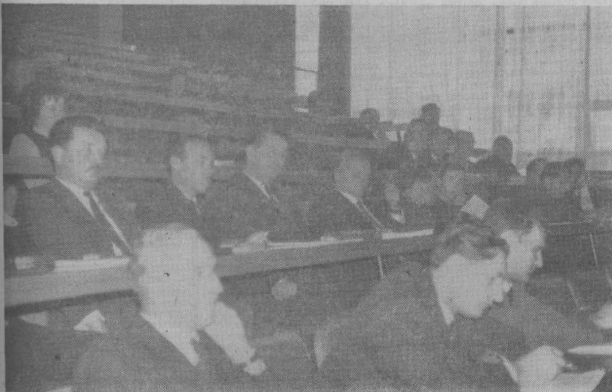
Delegati so na konferenci razpravljali o šolstvu, varstvu otrok, kmetijstvu, mladinskih klubih in delu mladine, trgovini, delu krajevnih skupnosti in KO SZDL ter o perspektivnih gospodarskih nalogah.

PRIDITE NA JAVNO ŽREBANJE V DELAVSKI KLUB