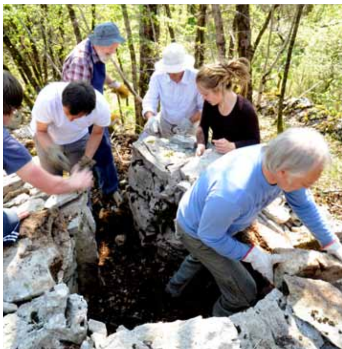
Slika 4: Delovni utrip, Lokev.