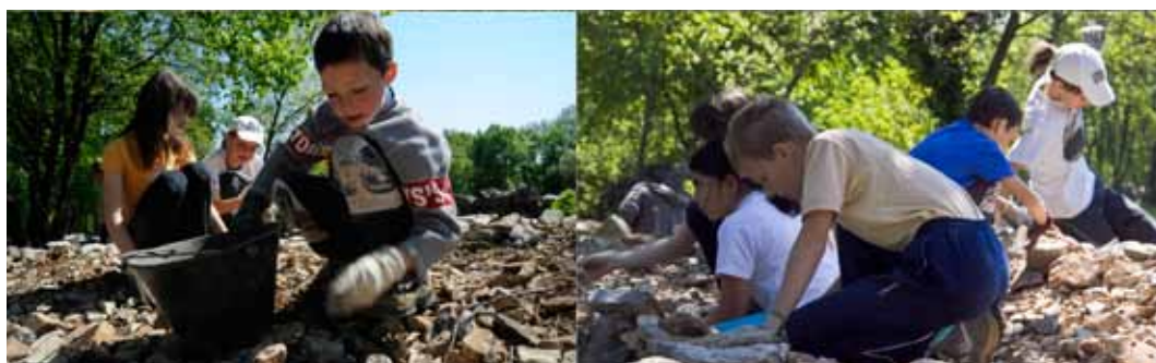
Slika 2: Utrinki z delavnice.