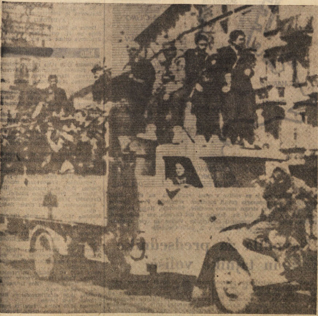
V Milanu 25. aprila 1945. Partizanska skupina se na kamlonu, ki ga je odvezla Nemcem, pelje proti središču mesta med navdušenim pozdravljanjem prebivalstva