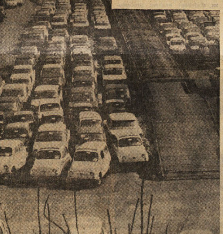
Iz Fiatovih tovarnov 3000 vozil na dan

Valletta se boji ameriškega vdora v Evropo - Podjetje zaposluje 120 tisoč delavcev in uradnikov - Povojne investicije nad 500 milijard