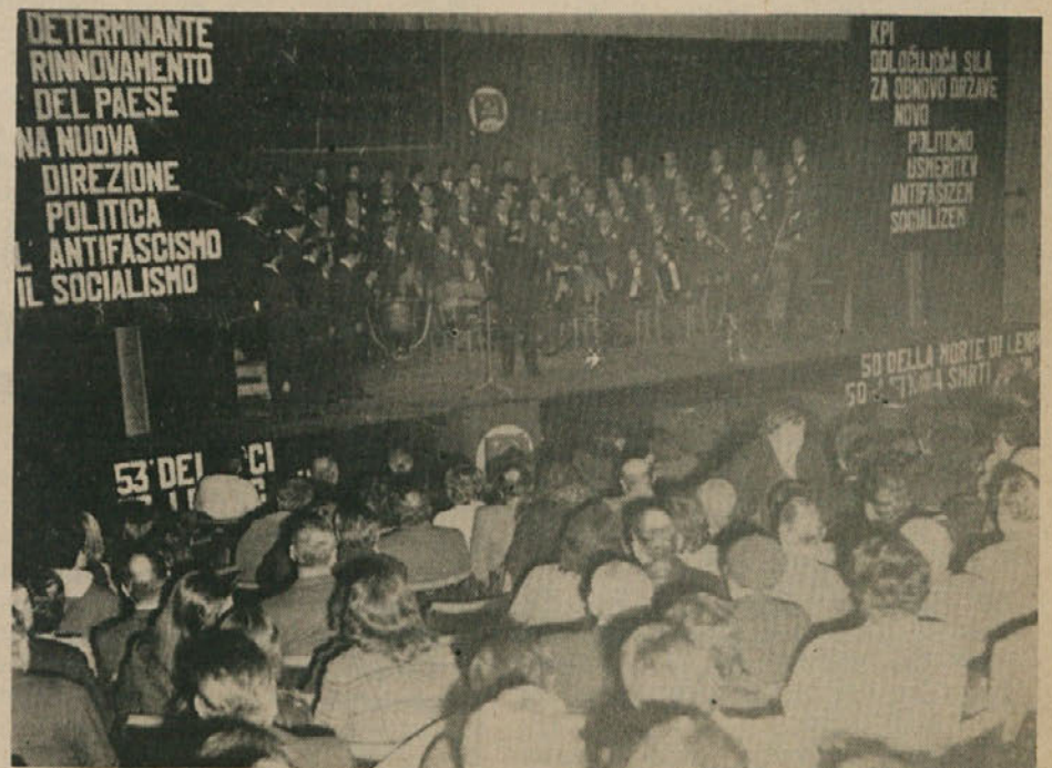
Manifestacija v tržaškem Avditoriju. O njej poročamo na 6. strani.