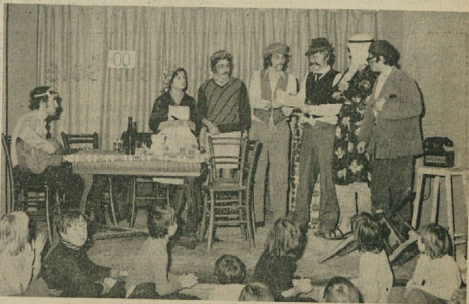
Dramska skupina PD Slovenec in Boršta je tudi letos nastopila s pristno igro z naslovom «Nej gori». Igra na šaliv način biča razne dogodke, ki so posredno ali neposredno v zvezi z domačo vasjo.

Pravljica v štirih dejanjih V torek 5. februarja ob 15.30