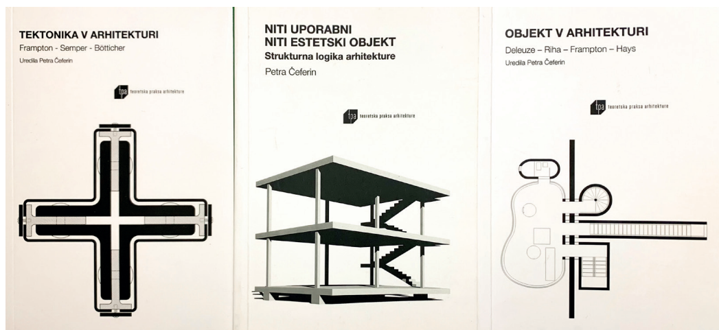
Naslovnice knjig iz zbirke TPA – Teoretska praksa arhitekture, Založba ZRC

»Prav neverjetno, da se vse do konca 19. stoletja in ponekod celo do sredine 20. stoletja ženske niso smele vpisati na študij arhitekture.«