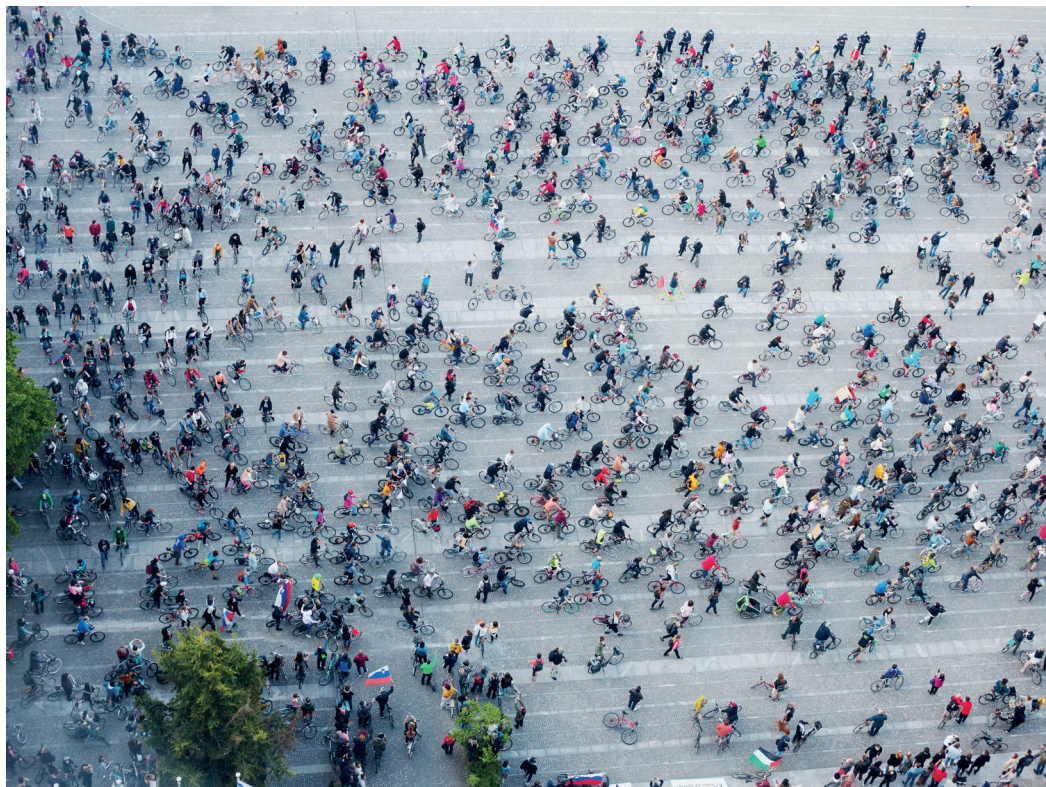
Trg republike, maj 2020

da misli. Ne dela zaradi zadovoljstva, pravi Deleuze, ampak dela samo to, kar je zanj ali zanjo absolutno nujno. Meni se zdi ta opredelitev dobra – da je ustvarjalno delovanje neke vrste prisila. Deleuze govori o filozofiji in filmu, a enako po mojem velja za arhitekturo.