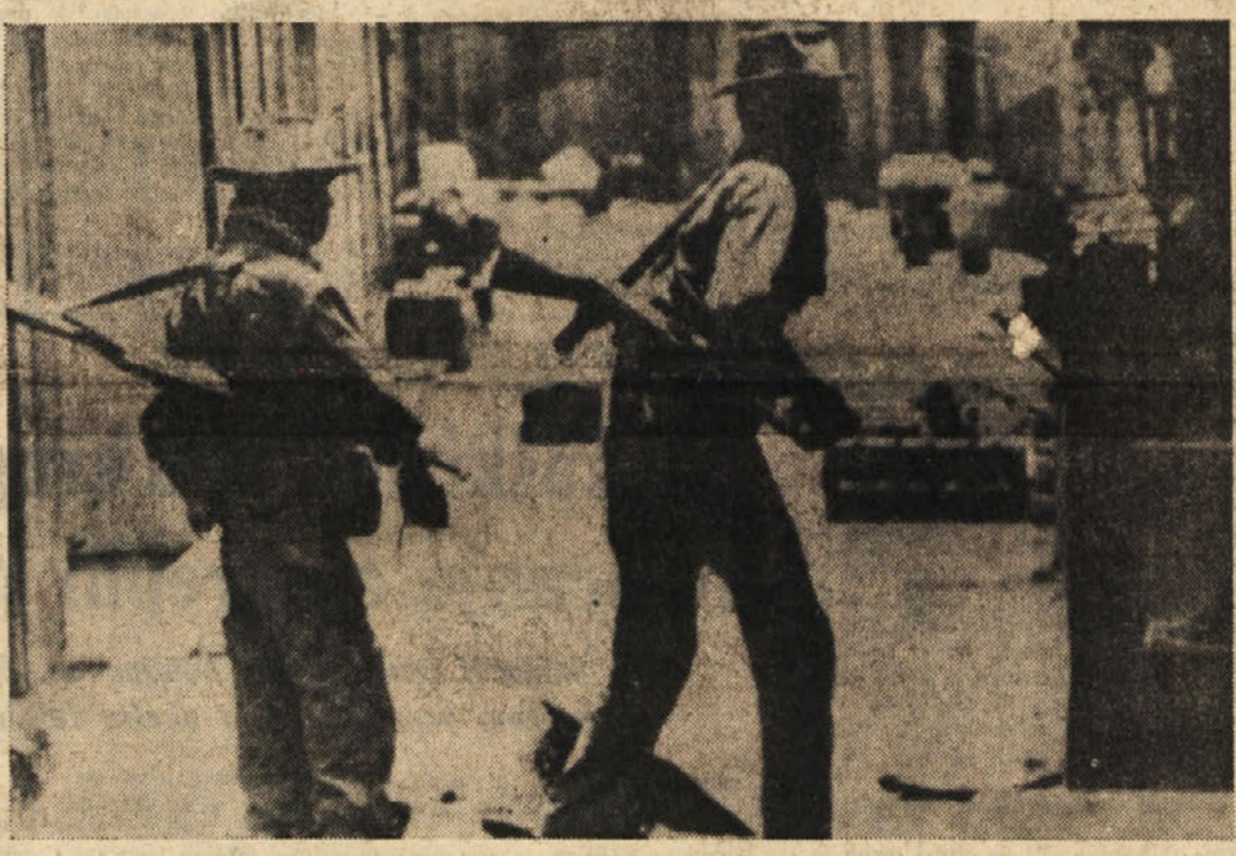
Vojaka kambodže vojske na straži v Chi Phuiju v bližini meje z Vietnamom. Kmalu potem, ko je bila posnela gornja slika, so vas zasledile protivladne sile

Ob 25. obletnici osvojitve minister za šolstvo Restivo je v predloženem zakonu predložil šolskim strokovnjakom, v kateri jih opozarja na visoki morali in vzgojni pomen te obletnice.