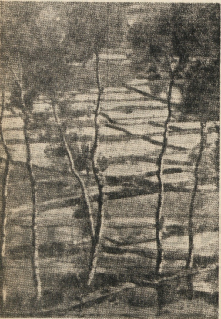
RIŽEVA POLJA PRI KOČANIH V MAKEDONIJI.

V stari Jugoslaviji so pridelovali riž samo v Makedoniji, predvsem na Kočanskem, Strumickem in Gevgeljskem polju. Sedaj pa izkoriščajo in pripravljajo močvirna in poplavna področja, sposobna za umetno namakanje, za gojitev riža tudi v drugih ljudskih republikah FLRJ.