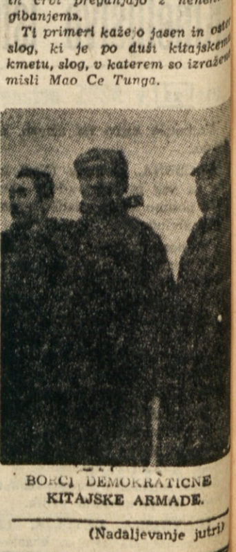
BOJCI DEMOKRATISKE KITAJSKE ARMADE. (Nadaljevanje jutri)

in črvi prepanjajo z nenahajajo gibanjem. Ti primeri kažejo jasno in očito, slog, ki je po naši kitajski misli Mao Ce Tunga.