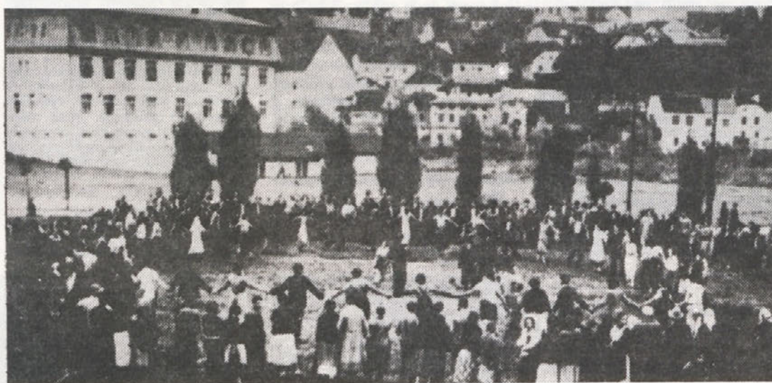
Stavka v tekstilni tovarni Jugošeška v Kranju avgusta 1936, kulturno življenje — koio . . .