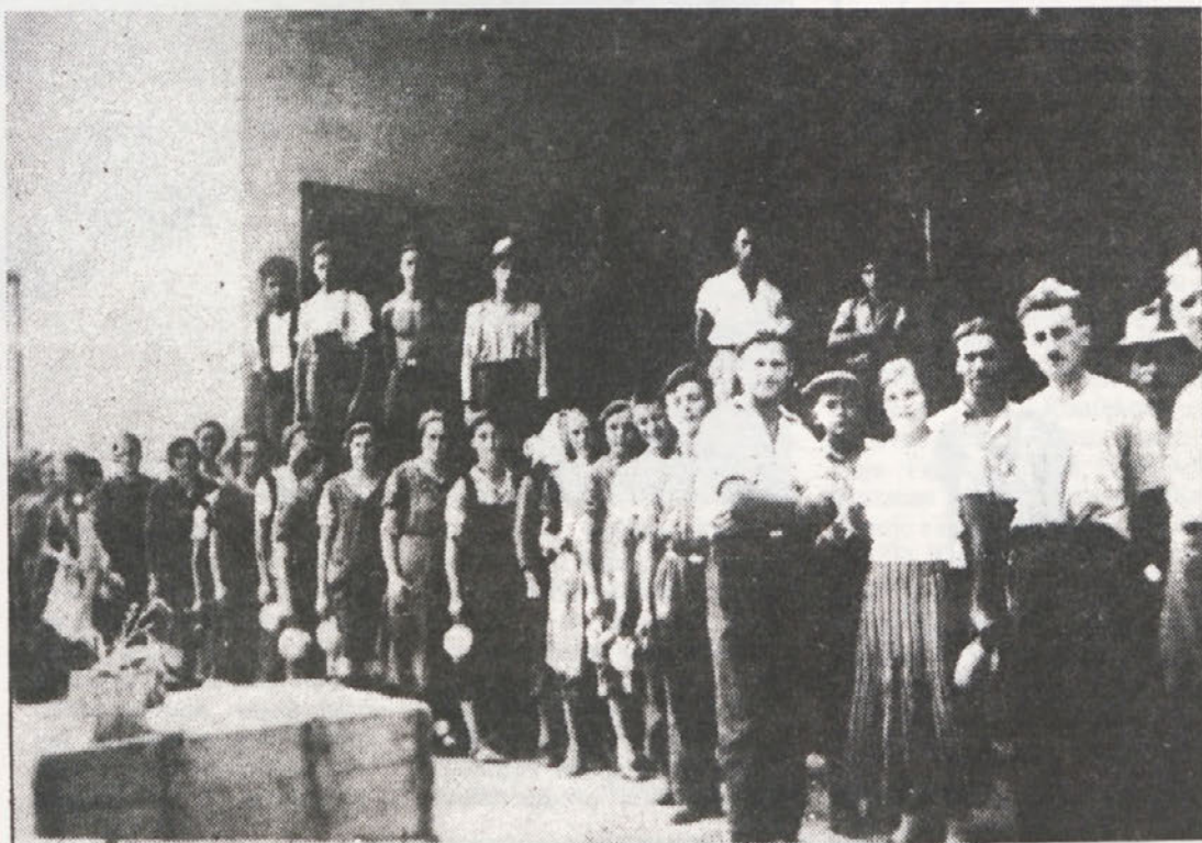
Tekstilna stavka v tovarni Inteks v Kranju: delavci čakajo na hrano