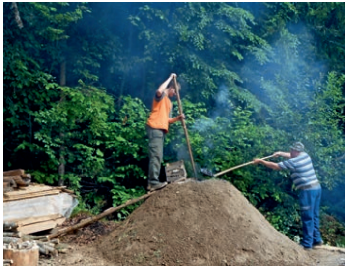
Prižiganje kope

Prireditve, ki jo sicer sofinancira Občina Logatec, pa se ni vrtela le okrog kope, pač pa so v društvu pripravili živahen program.