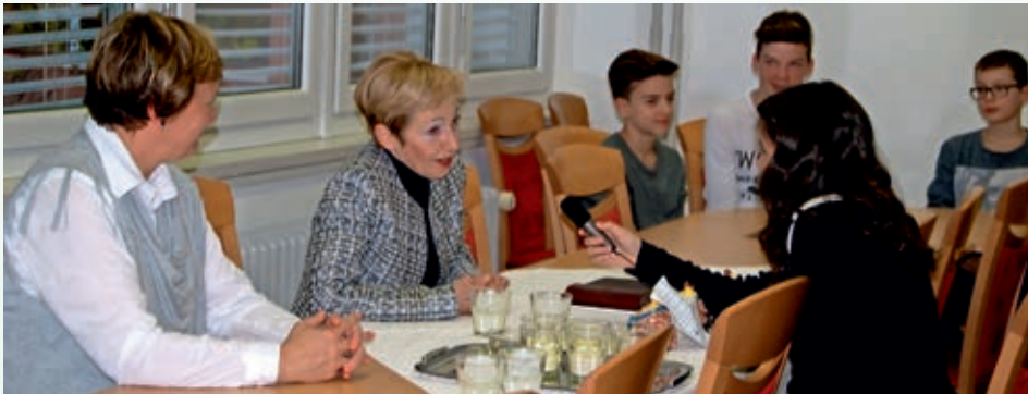
Ministrica za zdravje Milojka Kolar na obisku v OŠ 8 talcev Logatec