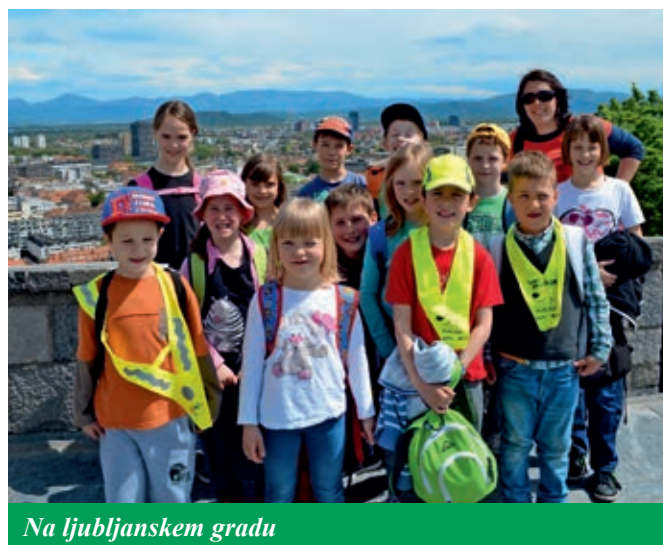
Na ljubljanskem gradu