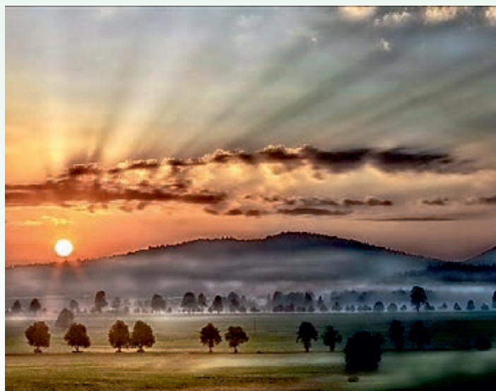
Zmagovalna fotografija na občinskem natečaju, v kateri je avtor ujel Napoleonov drevored ob sončnem zahodu

Ob stari Tržaški cesti, ki vodi iz Vrhnike proti Logatcu, stoji lipov drevored, eden najdaljših in najbolj znanih obcestnih drevoredov v Sloveniji. 290 lip in lipovcev na 1,9 km s svojo dominantno lego ob vstopu v naselje predstavlja svojevrstno značilnost Logatca. Po ustnem izročilu naj bi jih okoli leta 1810 zasadili v spomin na poroko med Napoleonom Bonapartejem in Marijo Luizo, hčerjo avstrijskega cesarja Franca II, zato je drevored svojčas nosil Luizino ime, kasneje pa se je uveljavilo ime Napoleonov drevored.