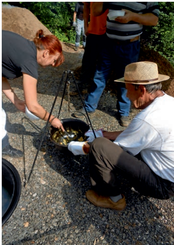
Polenta je bila slastna!