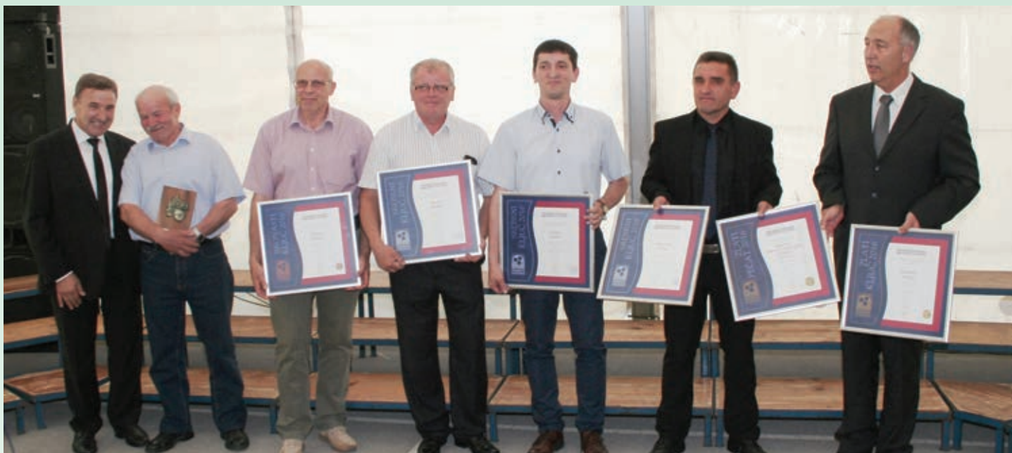
Prejemniki najvišjih priznanj - OZS in častnega članstva OZS Logatec.