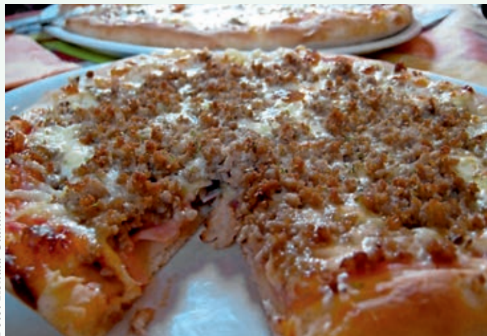
Izstopajoča pica v eni izmed logaških picerij

Na območju občine se lahko okrepcate. Štiri kmetije odprtih vrat so dobro poznane, a včasih ne tako obiskane, kot si zaslužijo. Na območju mesta Logatec je ena restavracija in pet gostiln, ena je še v Hotedršici, ena v Rovtah. Na območju občine imamo štiri picerije ter nekaj okrepcevalnic in pubov, barov ter peščico slaščičarn. Teško bi rekli, da katera gostinska kapaciteta po neki posebnosti ali trendu (npr. jedi, pripravljene z avtohtonih sestavin) precej izstopa, so pa nekateri razvili določene jedi, po katerih so prepoznavni v javnosti. Zaradi povpraševanja po malicah so slednje pri marsikaterem ponudniku prioriteta. Bolje so obiskani tisti gostinci, kjer so s postrežbo hitri in imajo večje porcije.