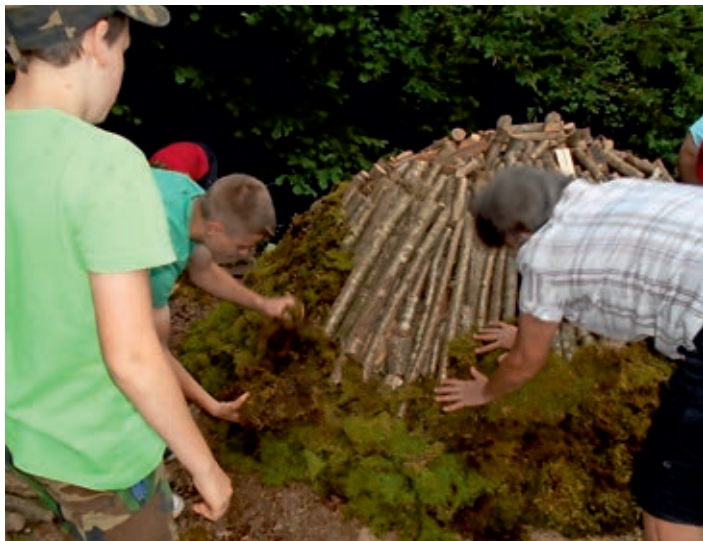
Priprava kope

K resna noč ima čarobno moč in posebno mesto v slovenski mitologiji, njeno praznovanje se je obdržalo še iz predkrščanske tradicije. Gre za praznovanje, slavljenje sonca in njegove moči oz. boga Kresnika, v krščanski tradiciji pa so se ti kresovi obdržali kot Ivanovi, Janezovi in Šentjanževi. Včasih je bil to tudi čas pričetka košnje. Ker je hotenjski zavetnik sv. Janez Krstnik, ima posebno tradicijo to praznovanje tudi v Hotedršici. Kulturno-turistično društvo že 23 let v tem času – na kresno nedeljo – organizira prireditve, na katerih obujajo stare običaje, ki v sodobnem načinu življenja že tonejo v pozabo.