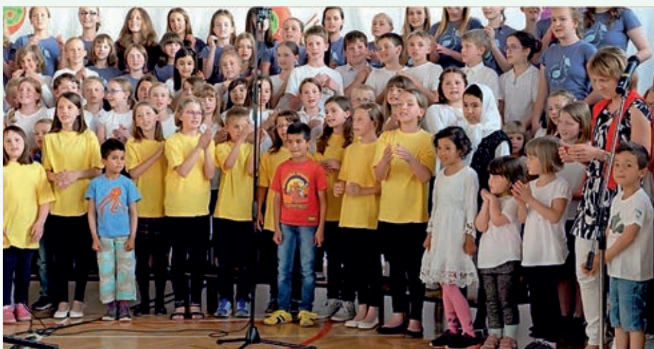
OŠ Tabor Logatec