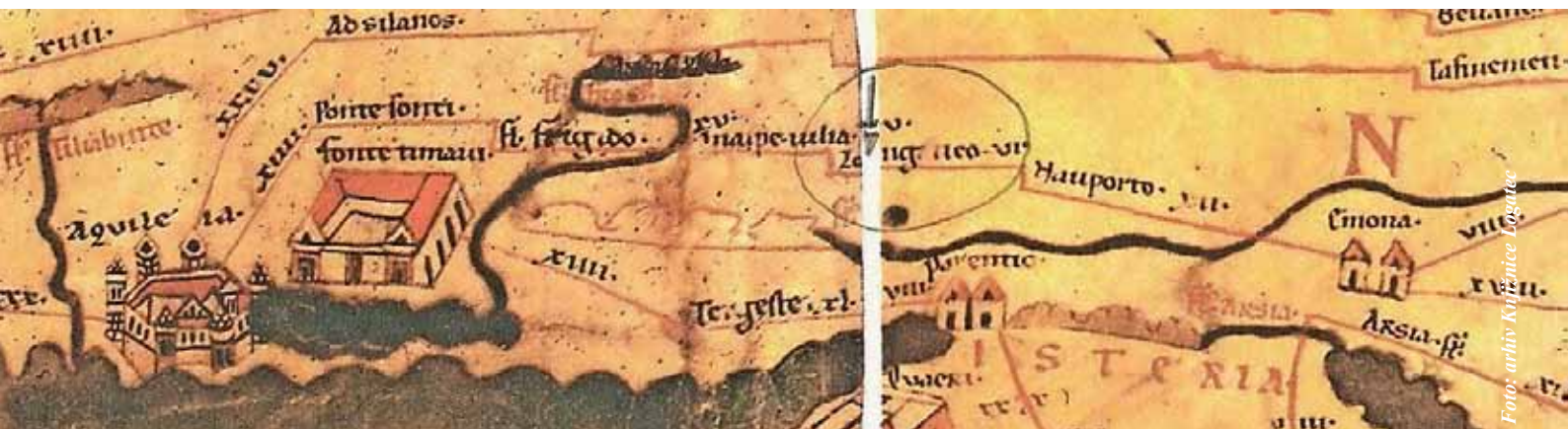
Avtocesta« pred skoraj 2000 leti: Tabula Peutingeriana, izsek iz 6,7 m dolgega cestnega zemljevida Rimskega cesarstva. Izsek se začne z Aquilejo (Oglejem), na sredini je Longaticum (Logatec) – označen s krogcem in puščico, potem Nauportus (Vrhniko) in Emona (Ljubljana).

29. decembra 2012 je minilo 40 let od otvoritve avtoceste med Vrhniko in Postojno, ki je del avtoceste A1 Šentilj-Srmin (imenovana tudi »Slovenika«) na osi SV–JZ Slovenije. Slovenika je dolga 245,3 km in povezuje večja slovenska mesta: Maribor, Celje, Ljubljano, Vrhniko, Postojno in (luko) Koper. Je sestavni del petega evropskega prometnega koridorja (Lyon-Kijev), ki povezuje Lyon, Milano, Benetke, Trst, Koper, preko slovenskega ozemlja skozi Ljubljano, Maribor, Lendava, Budimpešto do Kijeva.