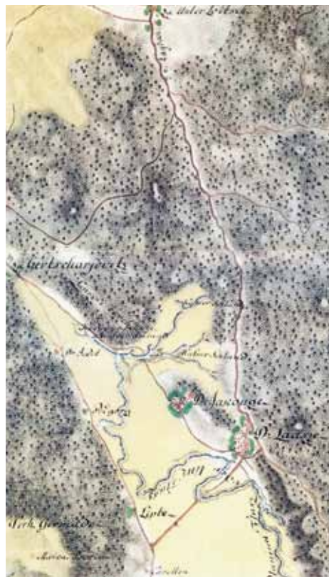
Del ceste Dunaj-Trst preko Logatca, Martinj hriba, Laz in Planine, obnovljene in »posodobljene« po l. 1719 na Jožefinskem vojaškem zemljevidu (1763-1787).

je bilo l. 1968 že več kot 25.500. Število smrtnih žrtev se je povečalo za več kot šestkrat – l. 1950 je na naših cestah umrlo 77 ljudi, leta 1968 pa že 497. Priprave na gradnjo avtoceste so trajale pet let, dela pa so se uradno začela 23. maja 1970. Še pred začetkom del se je pojavil zaplet s pridobitvijo posojila Mednarodne banke za obnovo in razvoj, znan pod imenom cestna afera. Pri projektu so sodelovali delavci iz vseh jugoslovanskih republik, predvsem pa iz Makedonije. Gradnja 32 kilometrov dolgega odseka avtoceste je bila razdeljena na tri pododseke: Vrhnika-Logatec, Logatec-Unec in Unec-Postojna. Avtocesto so zasnovali kot moderno štiripasovnico z odstavnim pasom. Pri projektiranju so sodelovali številni projektanti: Projekt nizke gradnje Ljubljana, IBT Trbovlje, Gradbinec, Mostogradnja, Gradis, biro za projektiranje Ljubljana, Mavrovo Skopje (Makedonija), Tehnogradnja Maribor in Gradis, nizke gradnje Maribor, GIPOSS Bung (ZRN) v sodelovanju z Gradbincem. Nekaj podatkov o gradnji AC Vrhnika – Postojna (iz LN št. 3, str. 5, 26.3.1971): dolžina trase: 31.989 m, širina cestišča: 26,40 m, predračun: 438 milijonov dinarjev, izkop: 3,2 milijonov m 3