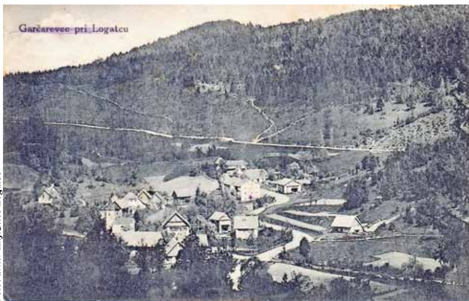
Razglednica Grčarevca pred 1. svetovno vojno. V ozadju je vidna stara cesta (zgrajena med l. 1803-1806). Pod njo del starodavne tovarniške poti.

materiala, asfaltna površina: 700.000 m 2 , material: 53000 ton betona, 4000 ton betonskega železa, 28.000 m 3 lesa, rok izgradnje: 1. november 1972.