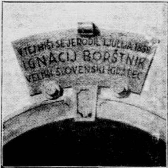
Spominska plošča Ignacija Boršnika