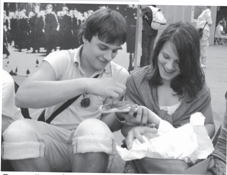
Domače, z dežele ...