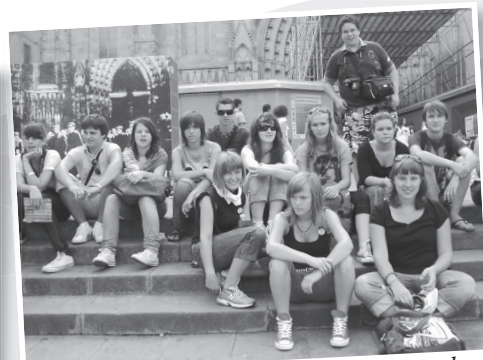
Vedno nas je bilo od 14 do 15, odvisno od ...