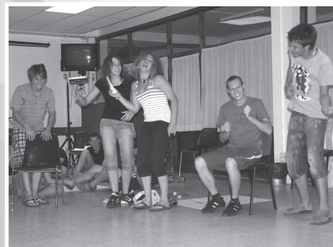
... in zanimivih interpretacijah besedil ...

Ljubi svojega bližnjega kakor samega sebe. Mr 12,31