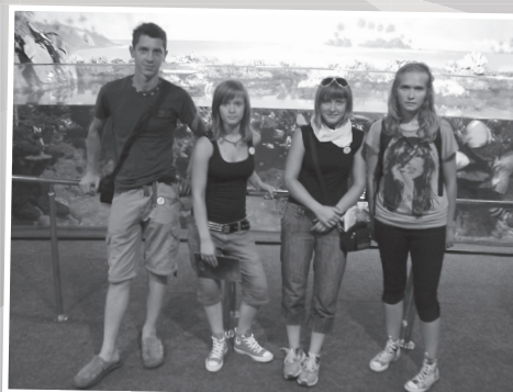
Ata pes, mama pes ... to so morski psi ...