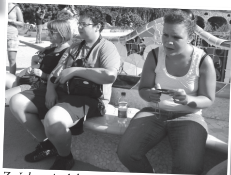
Začelo se je dokumentiranje, fotografiranje ...

Od 16. do 21. avgusta smo se animatorji salezijanskih župnij in SMC-jev podali na skupni izlet do Španije. Največja skupina smo bili Šentrupertčani, poleg nas pa so bili še mladi iz Veržeja, Maribora, Celja, Sevnice, Kodeljevega, Ankarana in Podgorice v Črni Gori. Skupaj nas je bilo kar 75. Občutili smo vroč utrip katalonskega glavnega mesta, a nas je ohladil tudi dež, najbolj pa smo se povezali med seboj in z Bogom pri odlično pripravljnih svetih mašah.