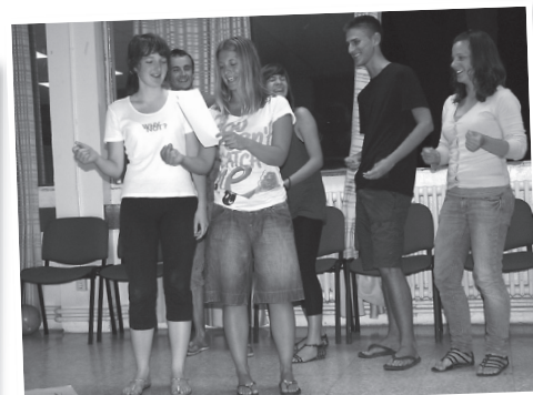
Veseli večer v glasbenih ritmih ...