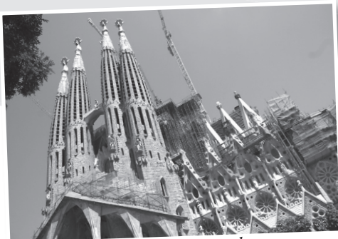
Vse se je začelo med dvema stolpoma znamenite Sagrade Familie v Barceloni ...