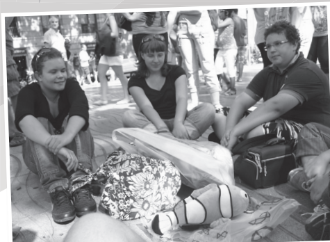
V akvariju smo ujeli Nema ...

Ljubi svojega bližnjega kakor samega sebe. Mr 12,31