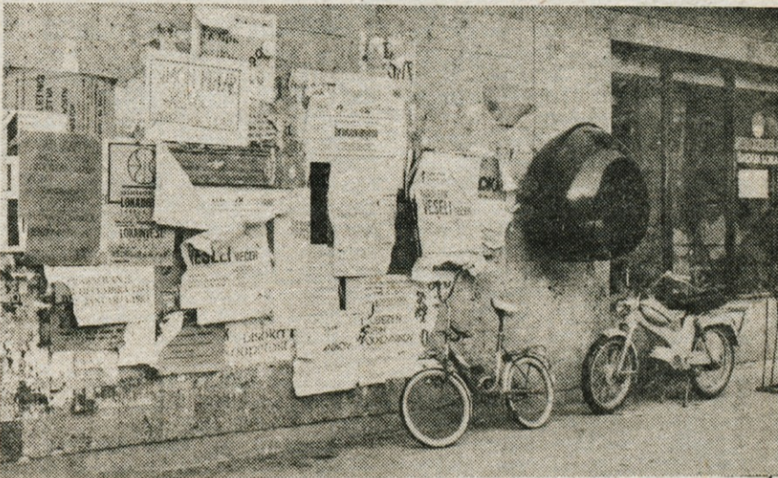
Škofja Loka — Pred približno dvajsetimi leti so uredili Cankarjev trg v Škofji Loki in prek njega speljali prijeten izhod iz Mestnega trga do avtobusne postaje. Žal pa tako dekorirana stena na prodajalni Mesoizdelkov ne pripomore k urejenemu izgledu.