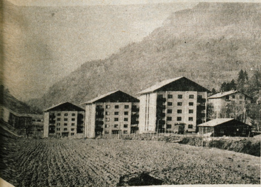
Koroški Beli so zgradili precej novih stanovanj, v kratkem se bodo vselili v stanovanjski blok.