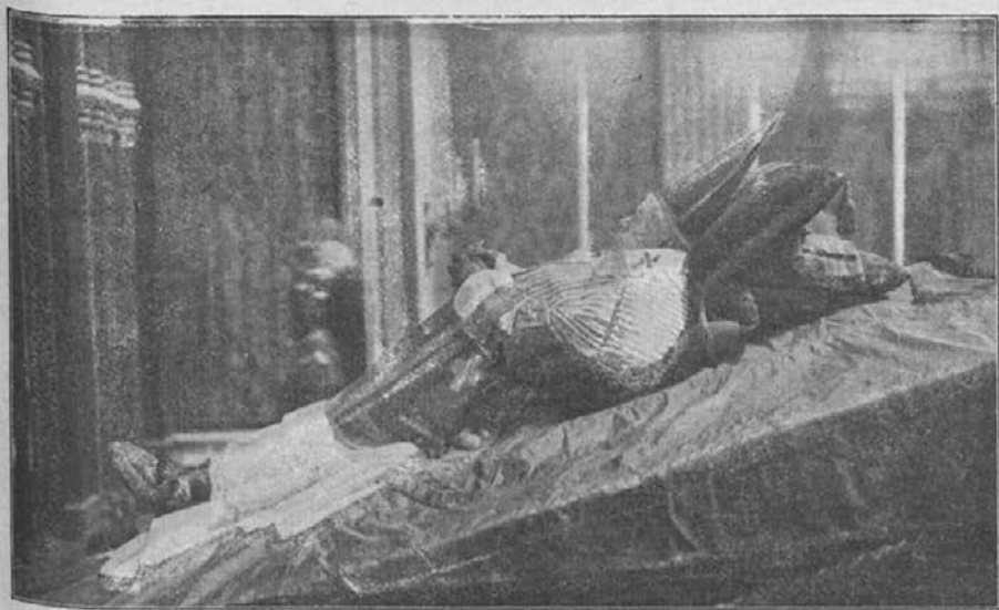
Papež Pij X. na mrtvaškem odru.

molila za njim. Polagoma smo prišli vedno bližje in končno so nas pustili v dvorano, iz koje peljejo vrata v sikstinsko kapelo. Na desno se je šlo v prostore, kjer so se vršile zasebne avdijence. Po 20 oseb se je pustilo na enkrat v dvorano. Soba je obita z rdečim blagom. Pod prestolnim nebom na rdeče pogrjenem ležišču leže zemeljski ostanki papeža Evharistije. Ena izmed nas je bila dopuščena z neko skupino, medtem ko sva morale medve še čakati v drugi sobi. Torej je še lahko dalj časa ostala v sobi umrlega, kakor medve. Šli smo notri in pokleknili. Molimo in gledamo belo