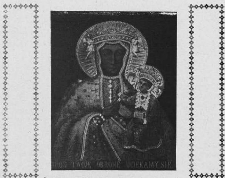
Čudodelna podoba Matere Božje Czenstochovske.