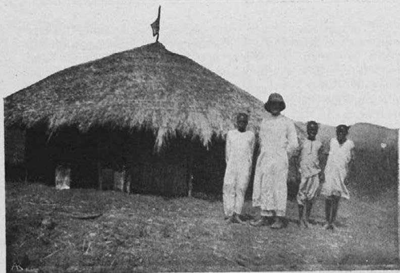
Naša cerkev. (Sv. Bonifacij.)