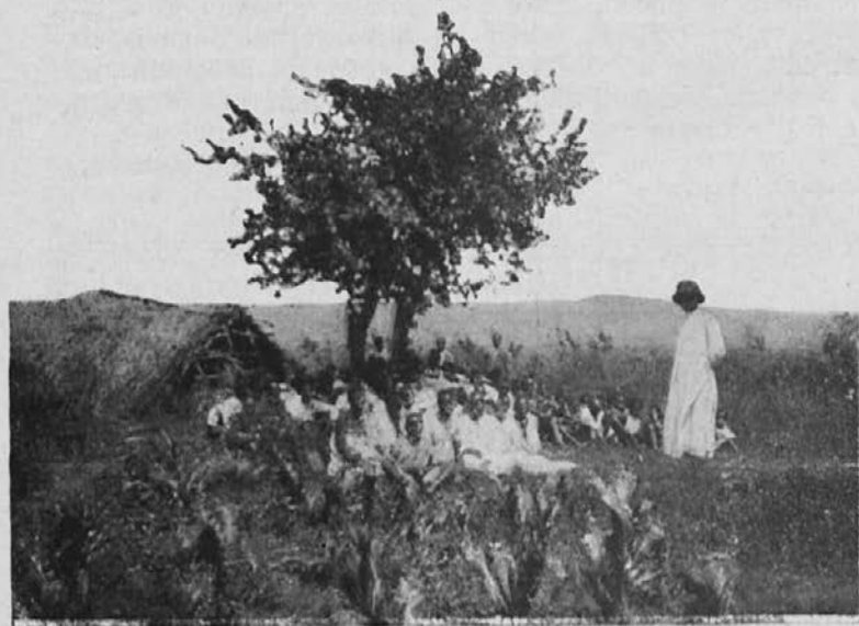
Poduk v katekizmu na prostem. (Sv. Bonifacij).