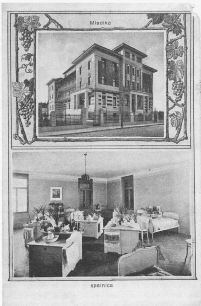
Slika 2: Razglednica ljubljanskega dekliškega internata Mladika.