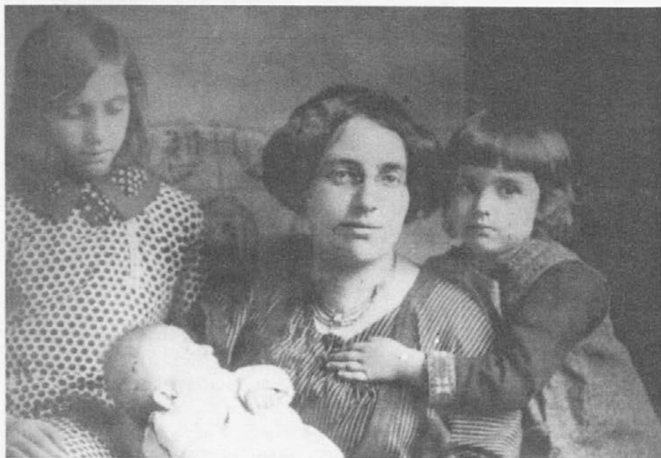
Slika 3: Zofka Kveder s svojimi tremi hćerami ok. leta 1912 (NUK, Ms 1113).

mene. Veselim se jako, da će biti sve tri moje kćerkice opet zajedno uz mene. Moramo onda opet ići još k fotografu. To ću si ja pokloniti sama sebi na božićni dar.