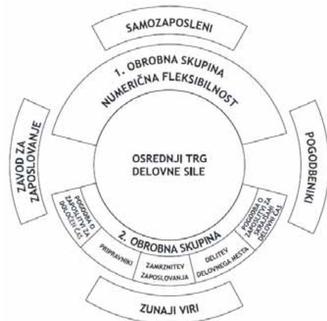
Slika 1 Atkinsov model fleksibilnega podjetja

R., Aparicio-Valverde M., (2000), str. 41