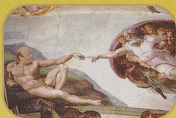
Satirična fotokompozicija, ki pričuje o Moggijevi "vsemogočnosti".

(drastični padec delnic Juventusa po izbruhu škandala, približno -50% v enem samem tednu) ter kaznih. Na srečo nas bo od vsega tega odvrnilo svetovno prvenstvo, katerega Italija se tradicionalno ne more udeležiti brez polemik. Letos ni tradicio-