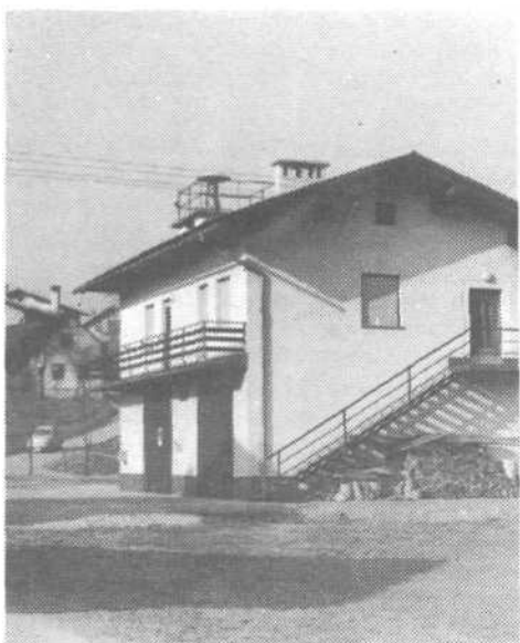
Novi gasilni dom v Goričici

Sicer pa krajani Goričice hodijo po vsak-