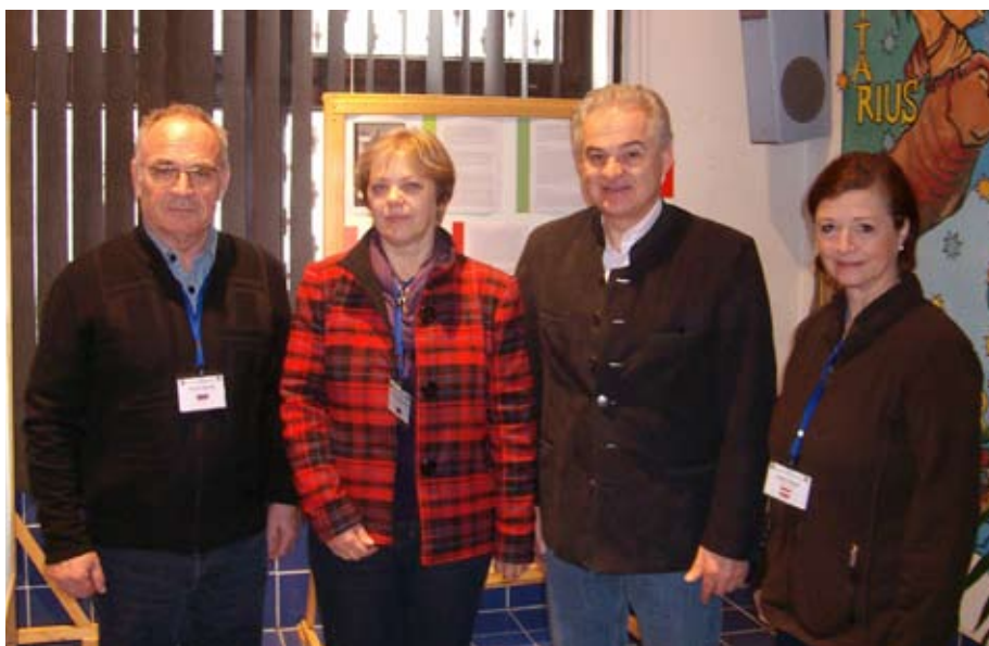
Župan Moravč, županja Medzeva, predsednik in sekretarka združenja

Gospodarski in družbeni standard je precej nižji od našega. To velja tudi za