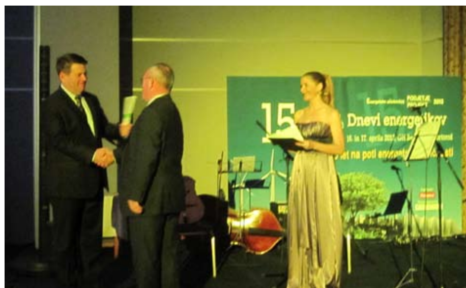
Nagrada bralcev časnika Finance

misija je nagrado prisodila našemu lesenemu pasivnemu montažnemu vrtcu in kotlarni na biomaso. Obenem z nagrado naši občini so prejeli priznanja predstavniki podjetij, ki so sodelovali pri projektu: Zarja Ekoenerija Semič, Geoplan Kamnik in Rima Ljubljana.