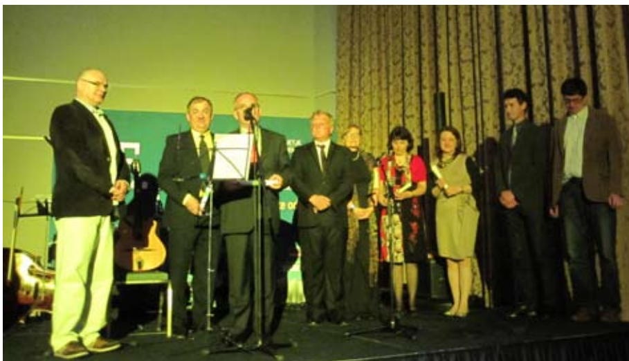
Nagrada strokovne komisije