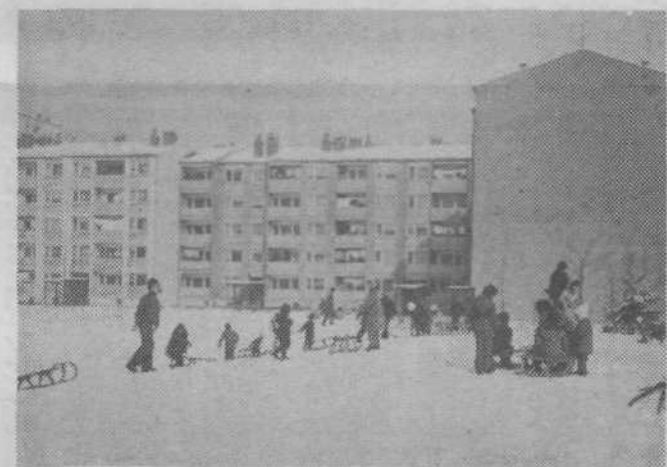
Zimsko veselje sredi naselja: »S polno paro, samo da dobro teče!«