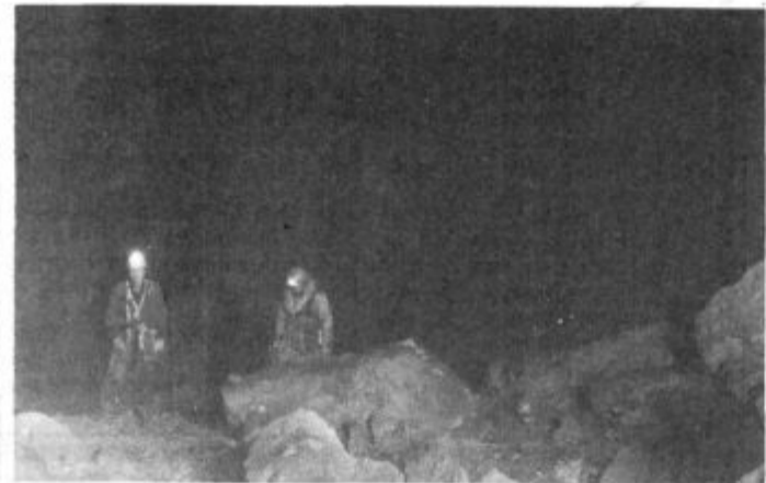
zaprav zahajamo v jame. V teh »bojih« je človek — jamar običajno zmagovalec, nič kaj prijetna pa ni misel, da je kaj hitro lahko tudi drugače. Sledilo je nekajminutno brodenje po do 1 meter globoki vodi, ki nas je privedlo do vzhodja 8 metrov visokega slapu, padajočega čez prav toliko visok skalni previs, ki ga je nekoč v davni preteklosti ustvaril tektonski prelom — vidna posledica sproščanja neslutelnih kolosalnih energij, kopičenih v notranjosti zemlje zaradi epirogenetskih premikov njenih plasti...

V soboto, 26. marca, smo se zgodaj popoldne torej napotili proti Peklu, katerega zunanja okolica je kljub lepemu vremenu še samevala. Jama namreč odprejo za turiste šele prvega aprila. Pred vhomom v jamo, ki se