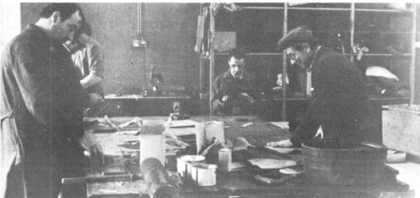
Rudarji-invalidi v obratu osnovnih zaščitnih sredstev

Resnici na ljubo je treba povedati, da smo ljudje takšni in drugačni. Nekateri si kljub svoji zmanjšani delozmožnosti prizadevajo biti njeni enakovredni člani, drugi se zadovoljijo le z upokojitvijo oziroma dodatkom za invalidnino. To seveda zopet ni prav. Tudi tem bi bilo treba pokazati pot, na kateri bi spoznali, da ni dovolj od družbe zahtevati odškodnino, ampak ji po svojih zmožnostih tudi kaj dati. Ker pa je sistem takšen, da nagruje lenuhe, kaznuje pa prizadevne, bo potrebno tudi na področju zakonodaje narediti čimprej velik korak naprej. Količnice resnice je v reku Edvarda Kardelja: »Srečo človeku ne more dati niti država, niti sistem, niti politična partija. Srečo si lahko ustvari človek sam,« pa naj presodi vsak izmed nas. (tap)