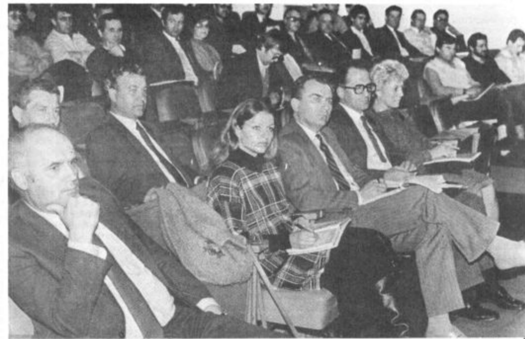
Komunisti občine Velenje so prejšnji četrtek na programsko volilni konferenci poglobljeno ocenili družbenopolitične, samoupravne in družbeno ekonomske razmere s posebnim poudarkom na prestrukturiranju gospodarstva. Sprejeli so obvezujoč program idejnopoličnih aktivnosti. Več o tem na 3. strani.