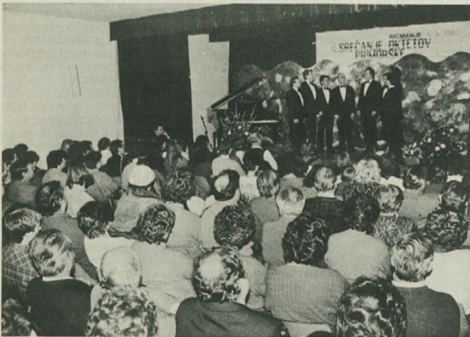
4. srečanje oktetov Primorske, ki se je odvijalo v nedeljo v Ricmanjih, je ponovno naletelo na veliko zanimanje občinstva, ki je napolnilo dvorano.