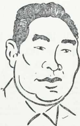
Ču En Laj, vodja kitajske delegacije v Ženevi

Verjetno je Dulles v posvetovanjih z zahodnimi delegacijami to resnico tudi dojel in priznal. Zato se je raje umaknil. Ameriški politični krogi menijo, da bo moral sedaj slišati precej grenkih besed od republikanskega vodstva, ki si v Aziji želi politično