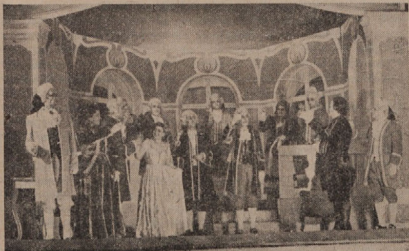
»Krajnski komedijanti« na celjskem odru