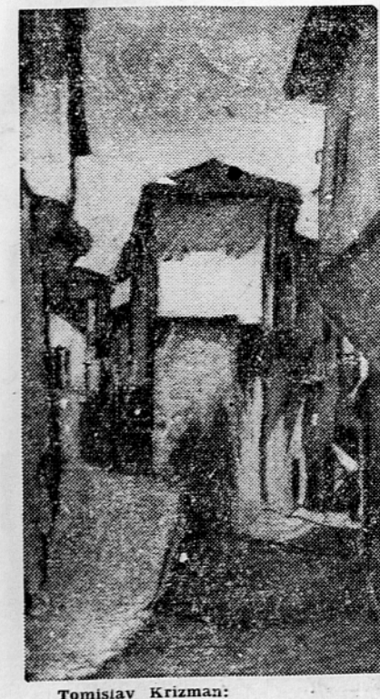
Tomislav Krizman: Prazna ulica, akvatinta

višjo strukturo izvoza. Dosedanja osnova izvoza iz Slovenije je bil les, saj je še lani tvoril 70% vsega izvoza. Po letošnjem načrtu se izvoz lesa zniža na 45%, medtem ko se bodo industrijski izdelki že dvignili na 30% izvoza. Za prehranbene in kmetijske predmete je določenih 25% izvoza, pri čemer pa je izrečno poudarjeno, da je ta izvoz popolnoma blokiran do 1. julija, ko bomo že jasno videli, kakšna bo letošnja letina.