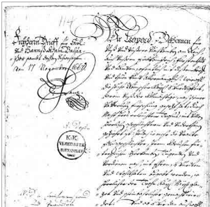
Začetek koncepta Valvasorjeve baronske diplome, izdane na Dunaju 17. novembra 1667 (ÖStA, AVAFHKA, Hofadelsakt von Valvasor, Karl und Johann Adam und die Schwestern 17. XI. 1667, fol. 2)

Jernej pa se je odločil za duhovniški poklic. Poleg tega je imela baronska diploma svojo ceno in Karel od svojih treh polbratov najverjetneje ni mogel pričakovati, da bi (lahko) prispevali del plačila. Tako je v prošnji cesarju Leopoldu I. prosil za stanovsko povzdignitev le zase, za bratrančevno vdovo (sicer svojo svakinjo) ter njenega sina in hčerko, ter seveda za celotno zakonito potomstvo pobaronjencev. Ne nazadnje so bili tedaj v rokah teh dveh družin vsi Valvasorjevi gradovi na Kranjskem, ki so nato prišli tudi v baronski naslov. Karel je imel Medijo kot »izvorni grad« kranjskih Valvasorjev in pred kratkim kupljeni Belnek pri Moravčah, vdova Janeza Krstnika pa je v imenu otrok gospodarila v Zavruhu pri Svibnem, »matičnem« gradu Adamove rodbinske veje.