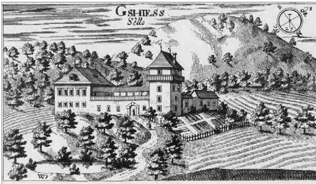
Dvorec Sela nedaleč od Bogenšperka, domovanje polihistorjeve vnovič omožene svakinje in njene družine, po Valvasorjevi Topografiji Kranjske ( Valvasor, Topographia , št. 78).