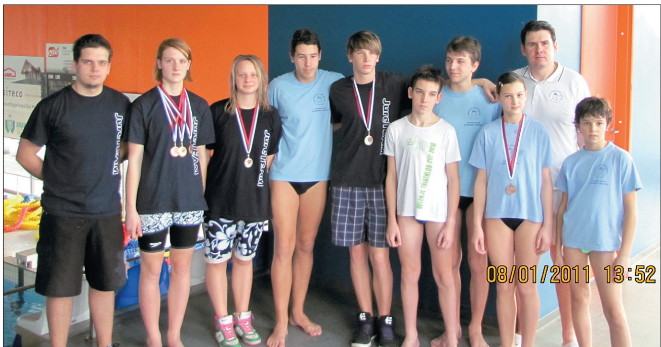
Trenerja in plavalci PK Terme Ptuj, ki so nastopili v Mariboru.