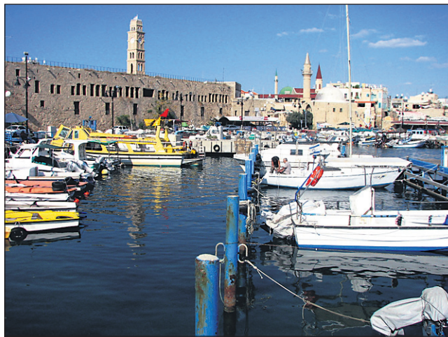
Tel Aviv in Jaffa