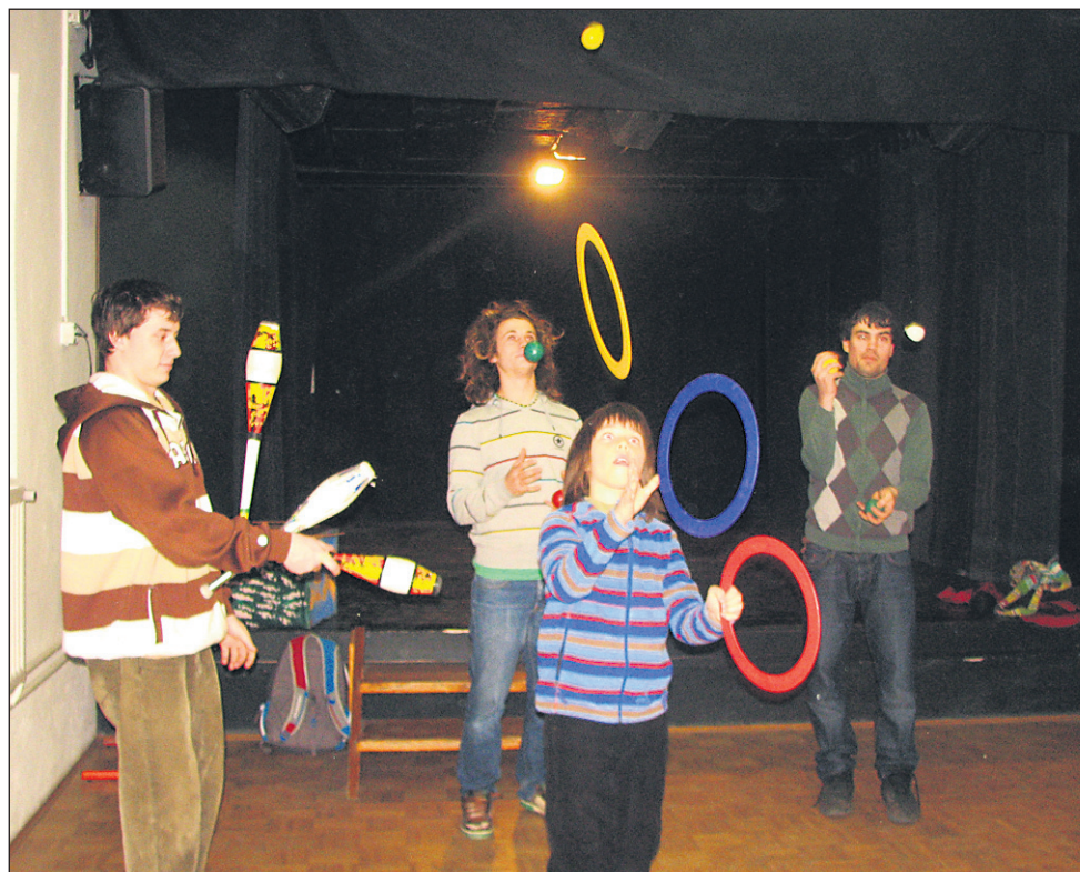
Utrinek iz začetne ure Male šole cirkusa