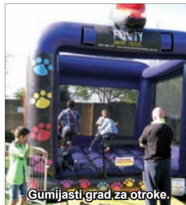
Gumijasti grad za otroke.