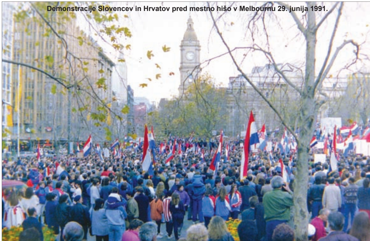
Demonstracije Slovencev in Hrvatov pred mestno hišo v Melbournu 29. junija 1991.

V uvodnih straneh je predstavitev delovanja avstralskih Slovencev, ki so že veliko časa pred letom 1988 sanjali o samostojni Sloveniji; sledi ustanovitev DEMOS-a in podpora, katero so nudili avstralski Slovenci.