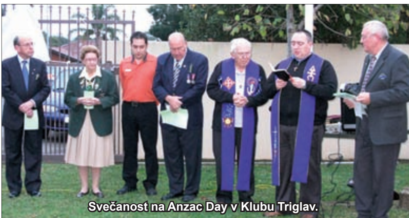
Svečanost na Anzac Day v Klubu Triglav.