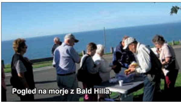
Pogled na morje z Bald Hilla.