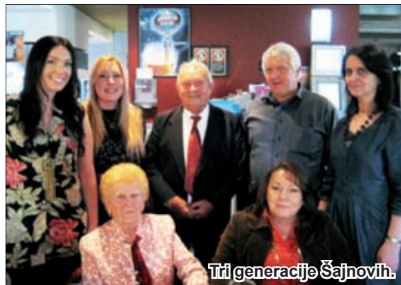
Tri generacije Šajnovih.