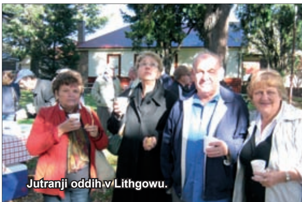
Jutranji oddih v Lithgowu.