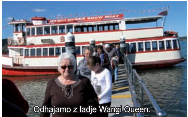
Odhajamo z ladje Wangi Queen.