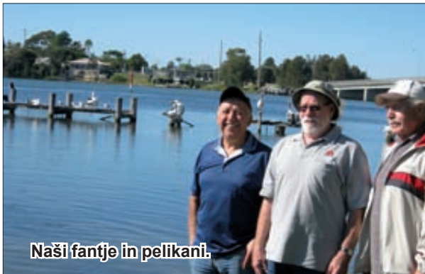
Naši fantje in pelikani.