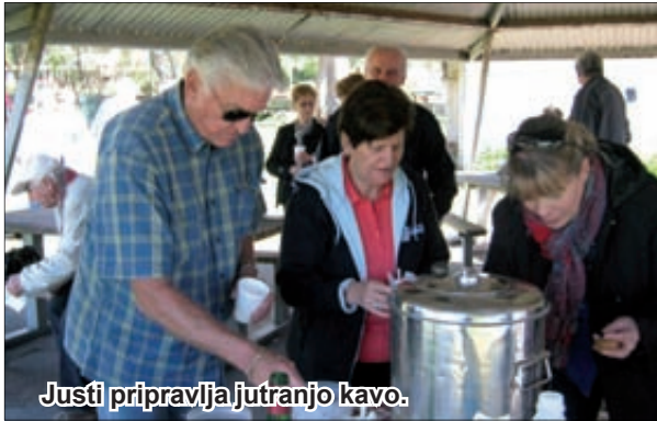
Justi pripravlja jutranjo kavo.