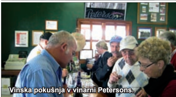
Vinska pokušnja v vinarni Petersons.