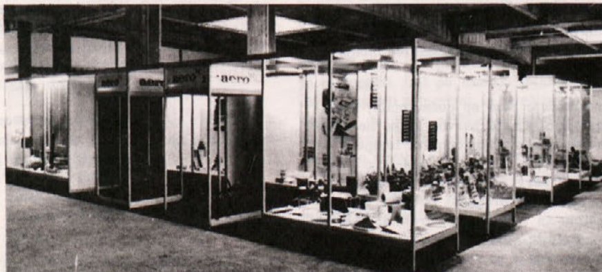
Naš paviljon na sejmu INTERBIRO 1971 v Zagrebu