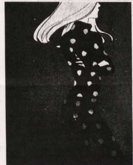
Primer dobro oblikovanega plakata

Vrednost oblikovalčevega dela se ne da oceniti po številu delovnih ur. Moramo se zavedati, da njegovo delo izvira iz idej. Do idej in do tega pa nikakor ne moremo priti na obrtniški način, temveč le z dolgotrajnim delom in študijem. Ločiti moramo obrtniško delo od intelektualnega, razumskega dela. Zavedajmo se, da je industrijsko oblikovanje umetniško delo, ne pa obrtništvo. Kipar - umetnik se ukvarja z upodabljanjem že obstoječega predmeta. Hoče upodobiti lepoto in popolnost na primer ženskega telesa. Oblikovalec pa hoče povdariti naravno lepoto z nakitom, obleko ipd. Vsi bi morali misliti progresivno, ne samo nekaj posameznikov.