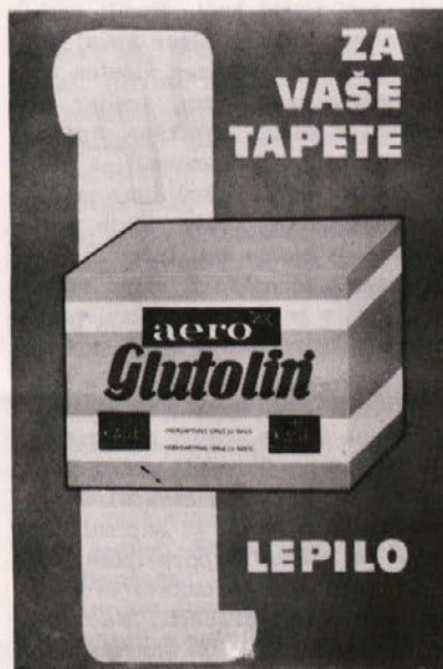
Primer likovno slabo oblikovanega oglednega kartona

Mislim, da je omeniti tudi neodgovornost odgovornih ljudi v podjetjih. Ali se res ne zavedajo vrednosti industrijskega oblikovalca, s pomočjo katerega bi lahko konkurirali na trgu, ali pa jim je vseeno, če bo proizvodnja neuspešna. Pa še tole.