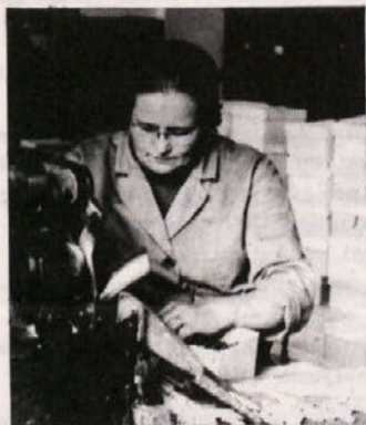
Sitar Anica pri polnjenju tub

Najprej sem si ogledala, kako izdelujejo tempera barve. Čeprav je bil moj prvoten vtis, da ne bom videla ničesar posebno zanimivega, sem po pogovoru z oddelkovodjem spoznala, da se motim.