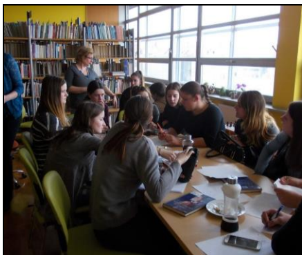
Slika 5: Razgibana debata članov bralnega kluba