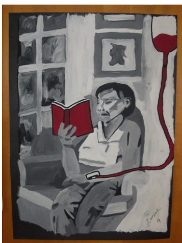
Slika 2: Slikovita predstavitev Knjižne infuzije ene od članic kluba

Na tak dogodek je povabljenih več dijakov, ki se na obisk gosta tudi ustrezno pripravijo: preberejo kakšno njegovo knjigo, se o njem pogovarjajo pri pouku, razpravljajo o temah, o katerih avtor piše, pri likovnem pouku ustvarjajo plakate, pripravijo kakšno glasbeno točko itd. Dijaki pogovor vodijo sami in postavljajo vprašanja. Tak način dela svetujejo in podpirajo številni proučevalci bralne kulture; naj navedemo misli, ki jih je zapisala Tilka Jamnik: »Srečanje z avtorji je najpogostejša, najbolj primarna in naravna, ena najučinkovitejših oblik promocije, tako med mladimi kot med odraslimi bralci. Ne le s pisatelji, čeprav z njimi res najpogosteje, ampak tudi z ilustratorji, prevajalci, celo uredniki. Ta srečanja so zelo različno pripravljena, mladi bralci jih radi pripravijo in tudi vodijo sami. Srečanja se dogajajo na knjižnih sejmih, po knjigarnah, šolah, knjižnicah in drugod« (Jamnik, 2017, str. 42).