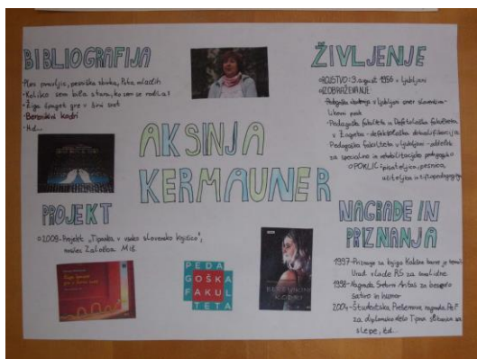
Slika 4: Plakat ob srečanju s pisateljico Aksinjo Kermauner

Dijaki, ki se udeležijo bralnega kluba, dobijo liste s citati ali pa listke s temami. Vse gradivo pripravi voditeljica v sodelovanju s knjižničarko. V sodelovanju s profesorico za likovno umetnost dijaki predhodno izdelajo plakate na določeno temo.