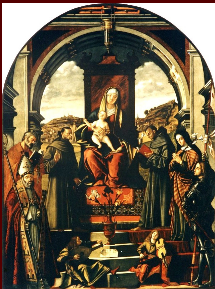
Vittore Carpaccio, Pala di Pirano, oggi Padova, chiesa di Sant'Antonio

V letih 1516 in 1518 je Carpaccio, v zaključnem obdobju delovanja, ustvaril nekaj mojstrovin: dve antitetični oltarni pali, ena se nahaja v Kopru, druga v Piranu. Zdi se, da bi lahko, na podlagi te 'raznolikosti', končno ponovno proučili poznega Carpaccia, predvsem po razstavi v Coneglianu leta 2015, in ga izvzeli iz vsakdanje "dekadence" in mojstrove provincialnosti, da bi se s posodobljenimi kritičnimi orodji soočili s smislom in naravo njegovega jezikovnega obrata, ki ne more (med drugim) biti ločen od nič manj pomembnega političnega in kulturnega razvoja v letih težkega prilagajanja ambicij in horizontov jadranske in beneške realnosti. Koprške pale ne moremo ločiti od umetnikovih del v mestni stolnici: pričakujemo vsaj delno obnovo orgelskih krilnih vrat in drugih plošč, ki so sestavljali razkosano in (v nedavnih in davnih političnih dogodkih) delno izgubljeno celoto. Na koprski oltarni pali - za razliko od piranske, na kateri se proces prenove kaže kot alternativa antonellove, bellinijeve in cimescove smeri, ki so bile takrat v polnem razcvetu, v korist realističnega preobrata, morda z vivarinijevskim vplivom - Vittore doseže enega izmed najbolj skrajnih vrhuncev svojega klasicističnega in bellinijevega obdobja, morda zavedajoč se samega Peruginovega nauka (v Benetkah med leti 1495-97).