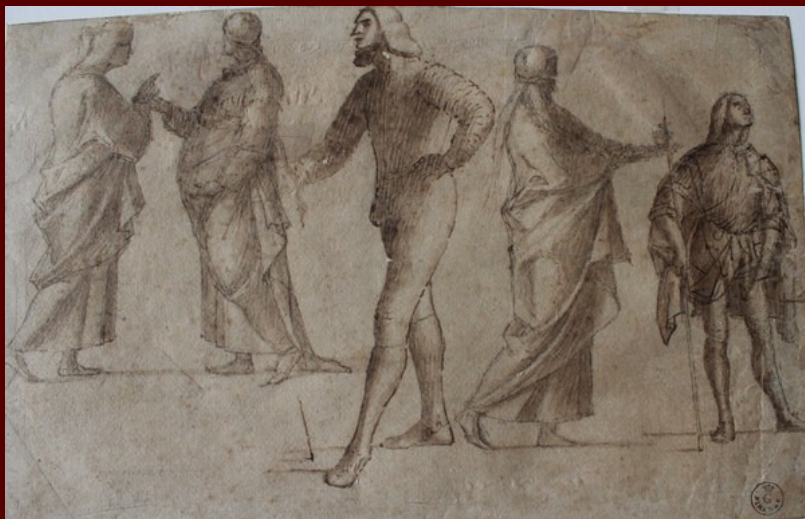
Vittore Carpaccio, Cinque figure stanti , Firenze, Galleria degli Uffizi, Gabinetto Disegni e Stampe (inv. n. 1688 F), matita nera, penna e pennello, inchiostro bruno, lumeggiature di biacca su carta bianca, 196 x 304 mm

Oltarno palo iz leta 1516, vključimo v obdobje, v katerem je Vittore ravno naslikal tri platna iz cikla svetega Štefana - ki so ključnega pomena za novosti, katerih vplivi bodo vidni v vseh njegovih delih in v delih sina Benedetto - in je bil že vpet v druge načrte. Posebej je treba omeniti dosežke v smislu organizacije prostora, ponovno zanimanje za dialog med figurami, novo občutljivost za kompozicijo, ki se je, kljub vztrajanju v rigidni postavitvi perspektive, sposobna obnoviti s pomočjo uporabe prefinjene arhitekturne perspektive, ki se igra z odtenki bele. Te novosti odsevajo tudi v koprski pali, ki je najbrž nastala po mnogoterih skicah. Kljub temu je proučevanje skic za palo, v poskusu razumevanja ustvarjalnega procesa, dejansko študij odsotnosti. Protiutež je obilje ponovnih uporab in invencij, ki jih vsebuje pala. Predvsem pa je navdih sama po sebi, saj začenja v mnogih stilističnih značilnostih zelo uspešno serijo del, ki imajo v sebi arhetip. Prikazan bo zbrani grafični material, ki ga lahko povežemo s palo v pričakovanju, da bi razumeli, kako je mojster ponovno uporabil nekatere svoje izume iz drugega desetletja 16. stoletja, poudarjajoč znanilce prihodnosti, ki jih je s palo prvič uporabil in ki bodo imeli močne posledice v sinovem delovanju.