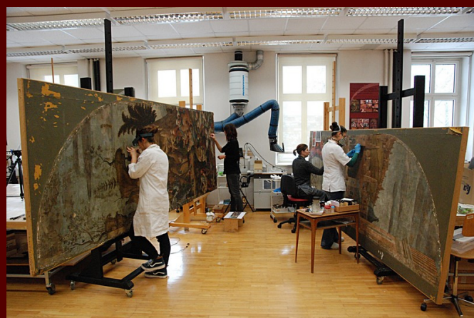
Vittore Carpaccio, Konservatorke-restavratorke med delom na orgelskih slikah