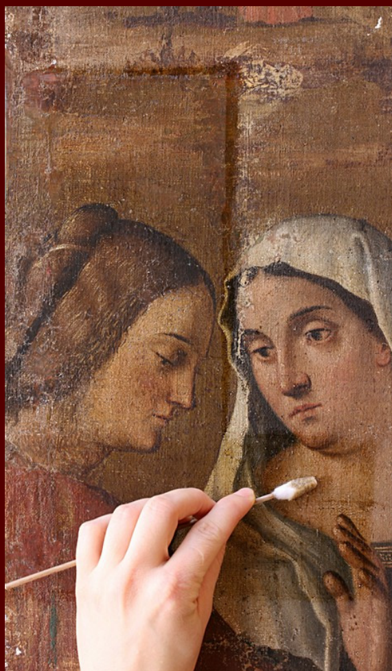
Vittore Carpaccio, Darovanje v templju , odstranjevanje neoriginalnih lakov