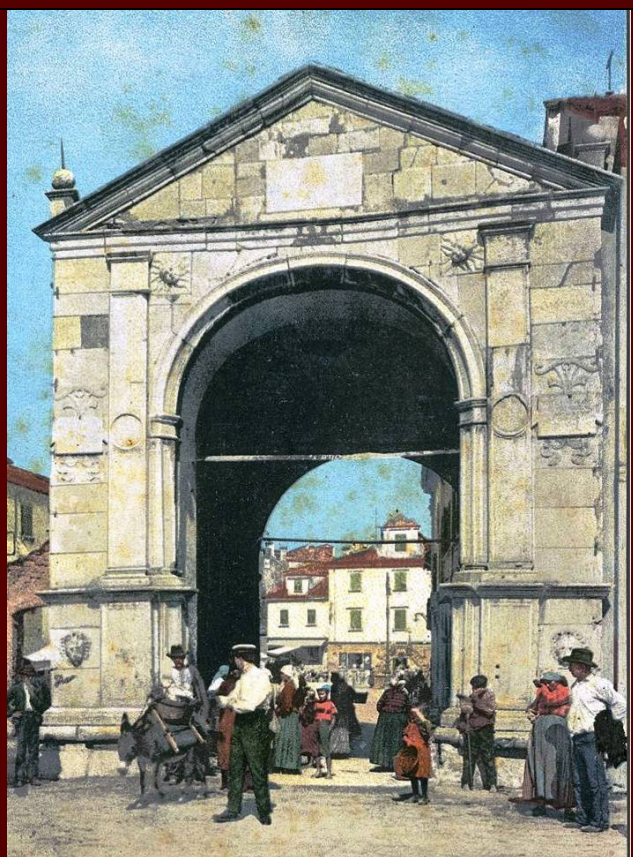
Capodistria, Porta della Muda, cartolina, inizio XIX sec.