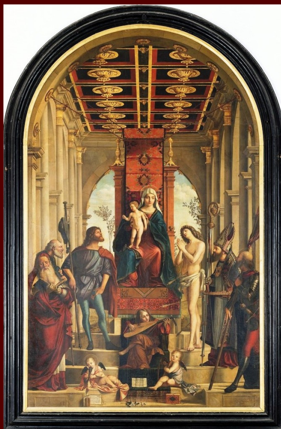
Vittore Carpaccio, Madonna col Bambino in trono, i santi Gerolamo, Giuseppe, Rocco, Sebastiano, Nazario - patrono di Capodistria-, Teodoro (Giorgio ?), Capodistria, Cattedrale, 350 x 240 cm (MRC)