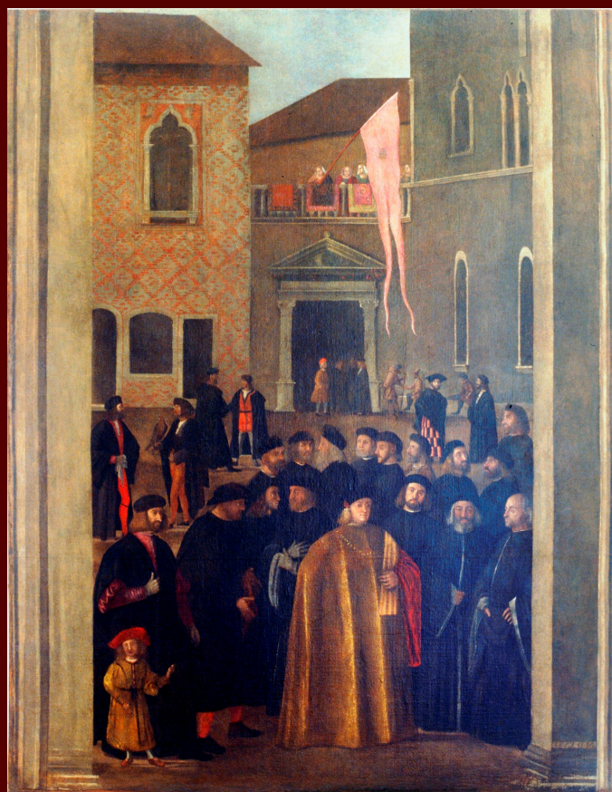
Vittore Carpaccio, Ingresso del podestà Contarini a Capodistria, 1517, Capodistria, oggi Trieste, Civico museo Sartorio (Polo museale del Friuli Venezia Giulia)