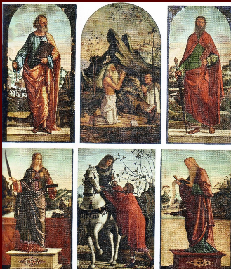
Vittore Carpaccio, Poliptih sv. Martina, Zadar, katedrala sv. Anastazije, danas Zadar, Stalna izložba crkvene umjetnosti

Vengono trattati i contenuti di alcuni dipinti dei maestri veneziani del XV e del XVI secolo in Istria e Dalmazia: i polittici dei membri della famiglia Vivarini sull'isola di Arbe e a Parenzo, il polittico di Carpaccio a Zara e le pale d'altare di Capodistria e Pirano. Sulla costa adriatica orientale la cultura figurativa del XV secolo, definita come un'arte tradizionale, proseguì anche nel secolo seguente. In tal modo i dipinti commissionati nella seconda metà del Cinquecento a celebri autori come Tiziano e Paolo Veronese per Ragusa e Verbosca sull'isola di Lesina, mantennero la tradizionale forma del quadro d'altare costituito da diversi pannelli. Si indaga inoltre la cultura artistica dei committenti, le circostanze religiose esistenti nonché i contenuti e i messaggi visibili e individuabili su tali complesse opere. Si nota una relativa semplicità tematica nella quale predominano le rappresentazioni dei santi locali, mentre l'influsso dei turbamenti religiosi ed ecclesiastici è appena percettibile. Agli inizi dell'età moderna il perdurare di una forma figurativa, una volta accettata e fatta propria, è una caratteristica della cultura artistica in Istria e Dalmazia che trova conferma nella pittura tardogotica e in quella rinascimentale. Su questi polittici le figure, disposte in una sequenza addizionale, formano un solo contesto con le teorie dei santi, mentre non esistono, o sono molto rari, i contenuti iconografici impostati in modo narrativo.