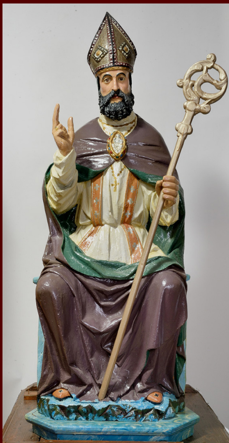
Bartolomeo Vivarini, kip sjedećeg sveca, Ližnjan, župna crkva sv. Martina

Nel XV e nel XVI secolo Venezia fu il centro produttivo di una nutrita serie di ancone caratterizzate dalla presenza di elaborate composizioni architettoniche, preziosi decori, rappresentazioni sacre e quadri con la raffigurazione di santi. Una parte di tali manufatti era destinato all'esportazione verso diverse aree della Serenissima ma anche al di fuori dei suoi confini. In tal senso, a quanto pare, esportatori particolarmente abili furono gli autori di altari lignei intagliati e dorati. Nell'ultima quindicina di anni si registra un notevole aumento di attestazioni dell'attività di intagliatori lignei a Venezia durante il rinascimento. Nella bibliografia storico-artistica datata i riferimenti relativi agli intagliatori li definivano principalmente come produttori di cornici dorate e solo raramente come maestri artigiani autonomi. Proprio in Istria si sono conservati alcuni esempi significativi di pale d'altare con figure a rilievo. Nel contributo, che tratterà solo i manufatti più rilevanti, verrà riesaminata la problematica concernente la loro attribuzione. Inoltre, verranno proposte alcune peculiarità iconografiche che compaiono sulle ancone intagliate e non sono presenti invece sulle pale dipinte. Verrà presentata anche un'ancona inedita proveniente dai dintorni di Verona, opera della bottega di Paolo Campsa, che introduce nuovi dati importanti per l'identificazione e la datazione dei prodotti di questa feconda officina su questa costa dell'Adriatico.