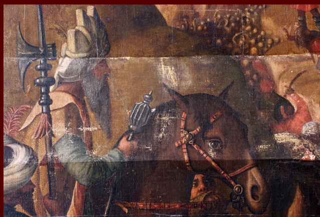
Vittore Carpaccio, Pokol nedolžnih otrok , odstranjevanje neoriginalnih lakov