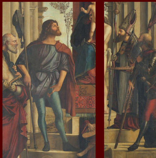
Vittore Carpaccio, Pala di Capodistria , particolare (MRC)