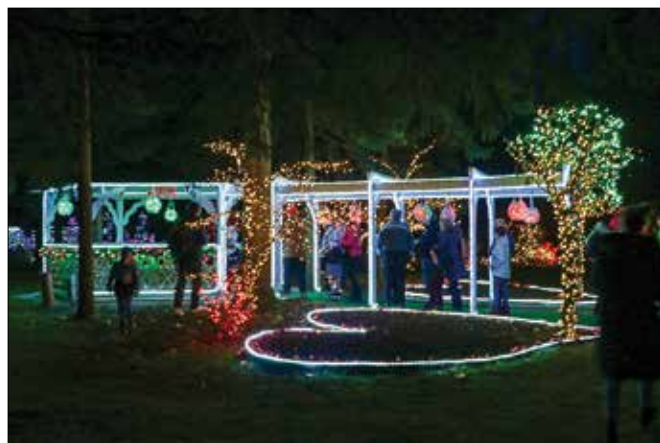
V solu lučk je vsako leto več objektov.