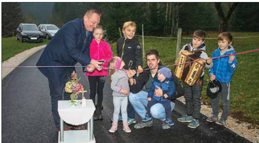
Trak so pomagali prerezati najmlajši krajanje, ki bodo poslej imeli boljše in varnejšo pot v svet.

Kot je še povedal župan, je bila rekonstrukcija že dolgo velika želja, slabo stanje ceste pa je klicalo po prenovi. Občina je za naložbo v prenavo okoli 1.200 m cestnih odsekov namenila okoli 150 tisoč evrov iz sredstev občinskega prora-