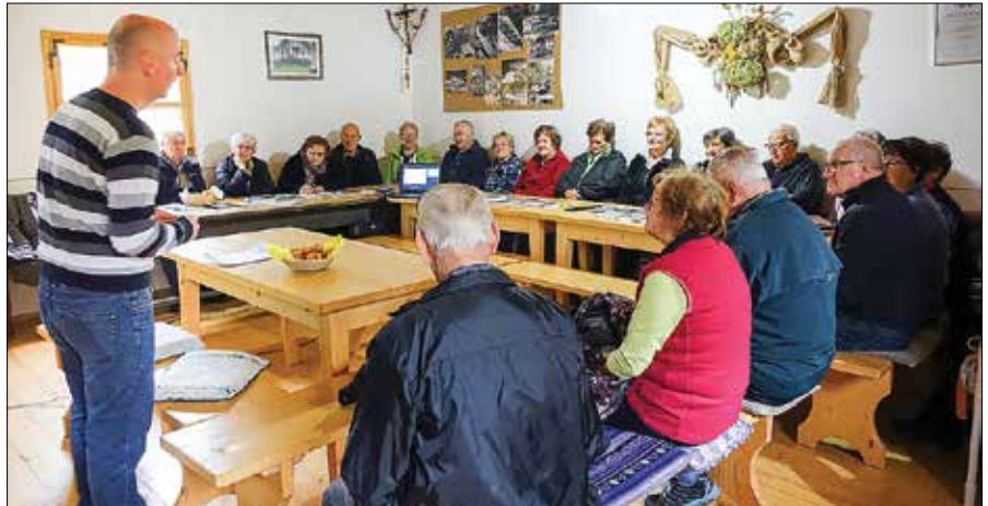
Člani Društva upokojencev Luče se zavedajo, da je osvežitev vozniškega znanja zelo pomembna.