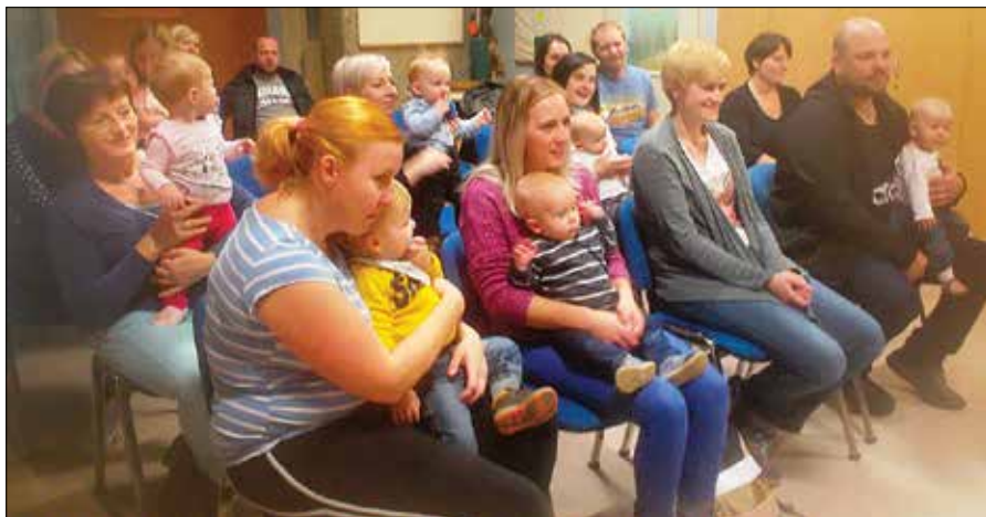
Sprejem so pripravili v prostorih rečiškega vrtca.