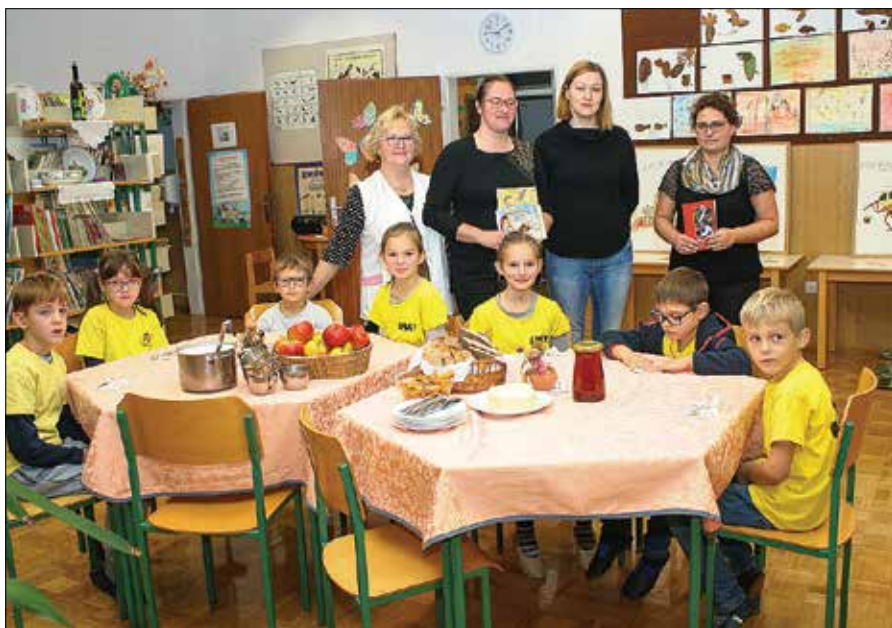
Učenci v Šmihelu so z zanimanjem prisluhnili svojim gostjam.