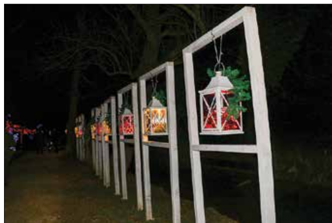
Letošnja aleja lantern je bistveno daljša kot lani.