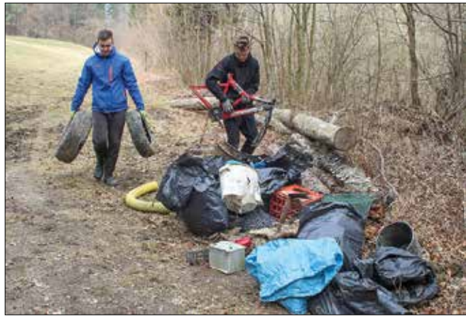
Ribiči vsako leto opravijo kvoto delovnih ur, ki jih določajo družine, predvsem se udeležujejo očiščevalnih akcij.

Prav tako je v vodah vse večje razraščanje alg. Deloma je za to kriva večja frekvenca obiskovalcev, zlasti v turistični sezoni, deloma gnojenje kmetijskih zemljišč, predvsem pred dežjem. Gnojilo takrat v