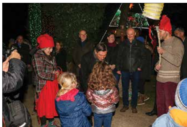
Predsednik Pahor si je vzel čas za najmlajše in z njimi poklepetal.