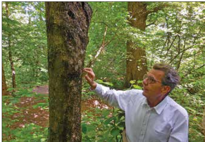
Javorov rak seže do 2,5 metra višine.

u v obliki sploščenega loka. Rakava tvorba (razpadajoča skorja in les) je največkrat na notranji strani loka. Večina rakov se razvije v spodnjem delu debla, do višine največ 2,5 metra, kjer je najvrednejši les.