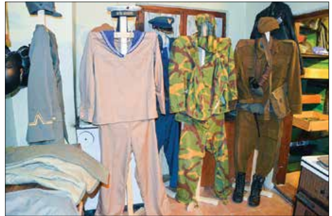
Za zbirko ureja prostor, kjer si bodo razstavljene predmete lahko ogledali tudi obiskovalci.

sneli na Veliki planini. Zanj so bili trije vikendi snemanja zelo zanimiva izkušnja. Člani kluba so pred premiero filma Preboj uprizorili dogajanja iz druge svetovne vojne in naredili promocijo filma na Prešernovem trgu v Ljubljani.