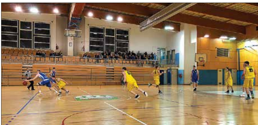
Nazarski košarkarji so jezo zaradi poraza na gostovanju v prejšnjem krogu stresli nad Vojnikom v svoji dvorani.