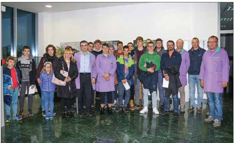
Predstavniki podjetja KLS Ljubno z učenci, dijaki in študenti, ki so se udeležili dneva odprtih vrat.