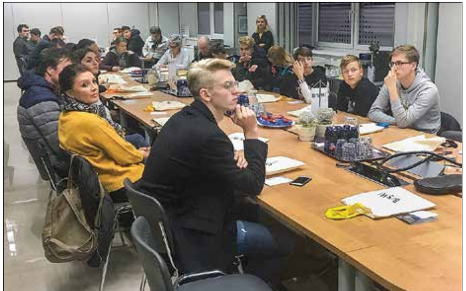
V nazarski družbi BSH Hišni aparati so našli 25 obiskovalcev, kar je v primerjavi s preteklimi leti presenetljivo visoka udeležba.

V KLS se lahko pohvalijo, da so z robotizacijo, avtomatizacijo in digitalizacijo procesov ter velikimi koraki v razvoju postali najboljši v svoji panogi v svetovnem merilu. Njihovi sodelavci upravljajo procese, ki so tehnološko najbolj napredni, zaradi česar imajo možnost, da se z nadaljnjim razvojem procesov sami razvijajo, nad-