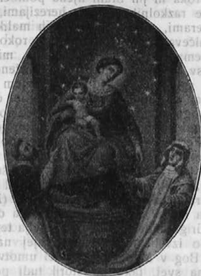
Kraljica sv. Rožnega venca.