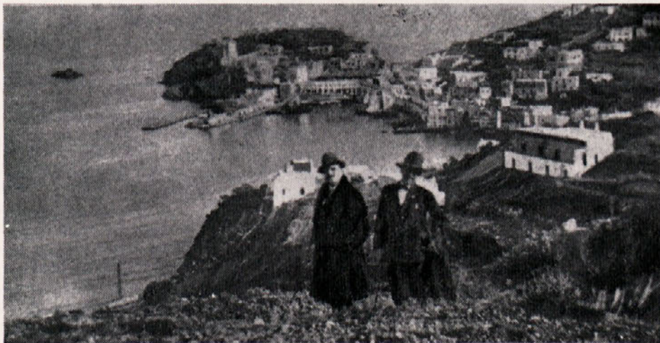
Otok Ponza. Na njem so bili konfinirani številni protifašisti