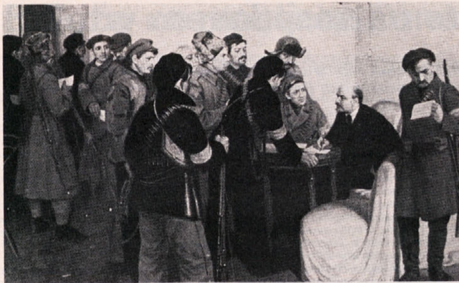
Lenin v Smoljnem v Oktobrskih dneh. Delo slikarja M. Sokolova

na samem njenem začetku videl v njej kažipot za izhod iz nevzdržnega stanja. Navdušenje je torej premagalo obupanost, učvrstilo revolucionarni duh med tržaškimi delovnimi ljudmi.