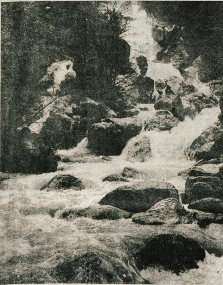
Z izkoriščanjem pritokov obeh Sor bi lahko letno pridobili dobrih 40 milijonov kWh električne energije