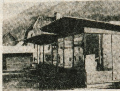
Če se malo sprehodimo okoli nesrečnih kioskov, je podoba še hujša, vredna obsodbe.