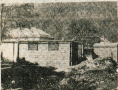
Prav sredi Kranjske gore so jih postavili, neenakih dimenzij in oblik, ki sem ne sodijo...