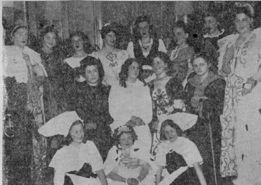
NAŠE IGRALKE, KI NASTOPAJO V IGRI "VICTIMA DE AMOR FILIAL"