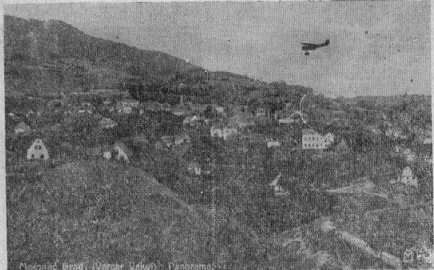
MRKONJIĆ GRAD, katerega so Mihajlovičevci po več kot dvajsetdnevnom boju zavzeli in združene sovražnike pognali v beg.

Carigrad. — "Deutsche Zeitung" poroča, da je v hrvatskih krajih v notranjosti zdravstveno stanje prebivalstva zaradi slabe zdravniške oskrbe izredno slabo. Navzlic temu, da je 89% vsega prebivalstva Hr-