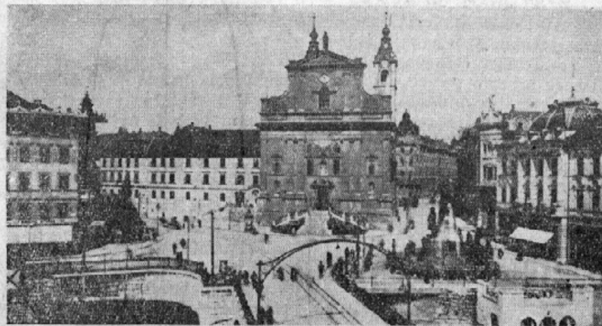
LJUBLJANA: pogled iz Stritarjeve ulice preko Ljubljance na Prešernov trg.