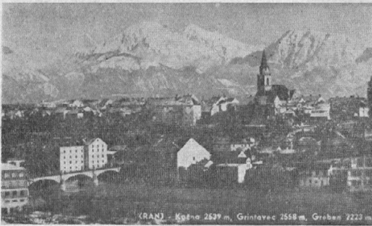
Mesto KRANJ na Gorenjskem. To naše mesto je v rokah divjaških Nemcev.

Slovenci v Ljubljani so videli v svojih kraljevih spomenikih simbol svojega jugoslovanskega prepričanja! Z odporom proti laškim zahtevam so manifestirali za Jugoslavijo. Uporabili so priliko, ki jim je bila dana, da so Lahom pokazali svojo zvestobo in ljubezen do Jugoslavije in njenih predstavnikov. In uporabili so jo izvrstno.